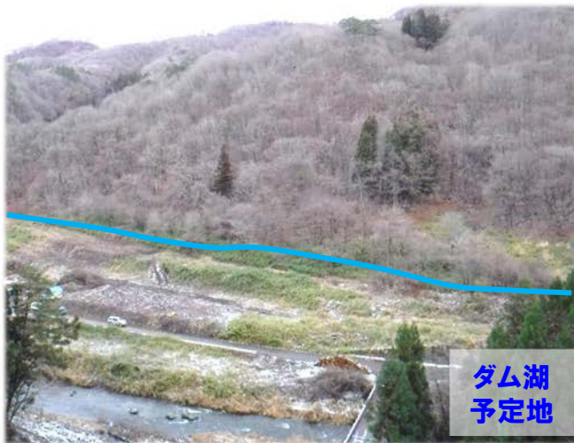
新県道 滝ノ沢橋より撮影

平成30年10月からダム湖予定地内で伐採作業を行っています。木は長期間水没すると枯れてしまいダム湖の水質が悪化したり、枯木の流出により洪水調節の障害となったりするため、ダムに水を貯める前に伐採します。概ねの作業工程として今年度は根田茂川沿いを、来年度は築川沿いを伐採します。2019年度内に完了予定です。