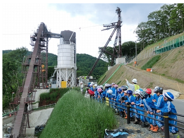
中野小学校5年生 現場見学

今年は築川周辺地域の方々が見学に來ています。過去の洪水体験談を交えつつ質問をいただき、築川ダムについて理解を深めていただきました。見学を希望される方は築川ダム建設事務所までお問合せください。