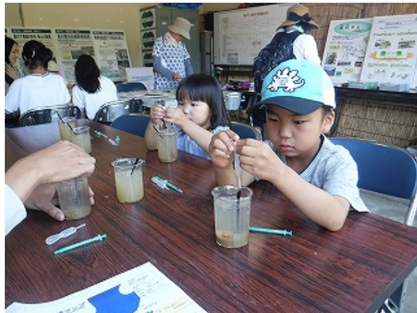
水をきれいにする仕組みの実験