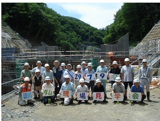
中野地区町内会連合会 現場見学