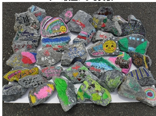
メモリアルストーン みんなの思いがダムの一部に