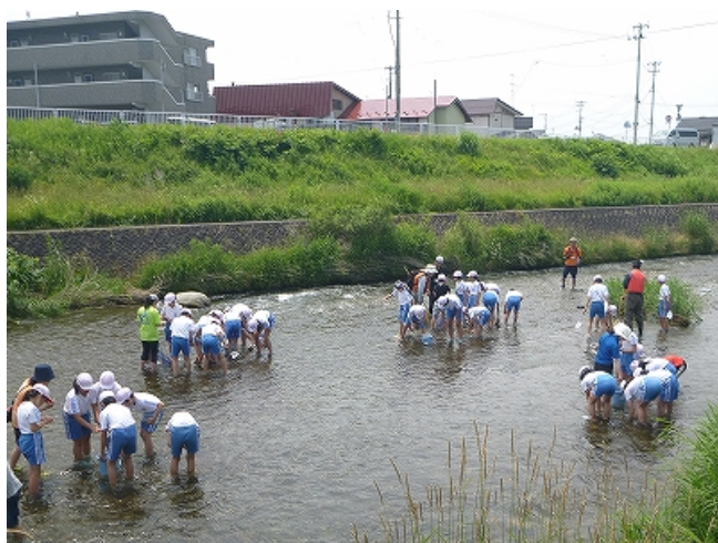
築川いきもの調査