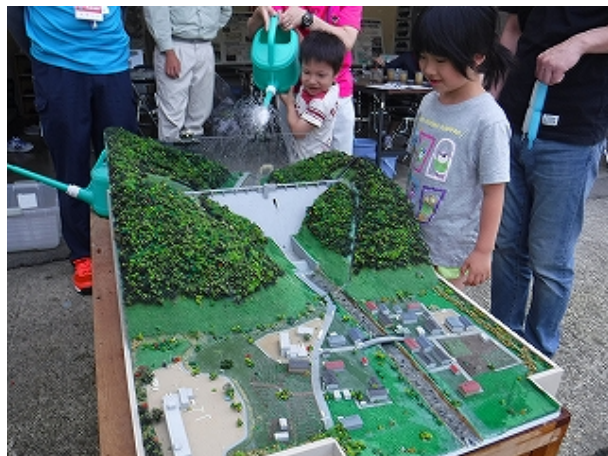
ダム模型による実験

平成29年7月26日(水) 綱取ダムで、森林やダムについて理解を深めることを目的とした『森と湖 in 綱取 2017!』が開催されました。イベントでは築川ダムの特設コーナーを設置し役割や工事内容のPRを行いました。当日は、子供達と一緒に「ダム模型」に水を流してダムのある時とない時の水の流れ方を比べたり、「ダム工事で使った水をきれいにする仕組みの実験」などにより、ダムの役割について理解を深めていただきました。