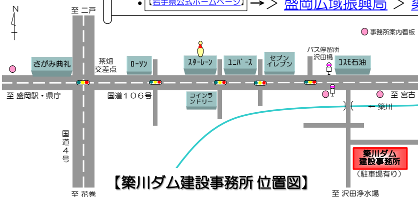
【築川ダム建設事務所 位置図】