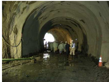
貫通したばかりの仮排水路トンネルを歩く