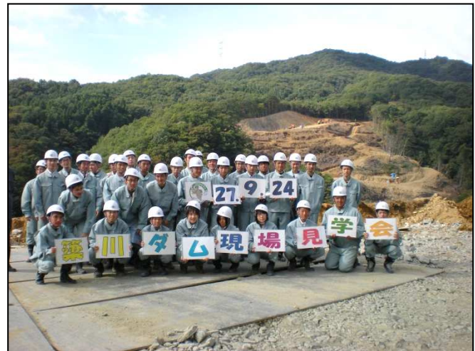
一関工業高校の皆さま

築川ダム建設事務所では、随時現場見学を受け付けております。 お気軽に下記連絡先までお問合せください。