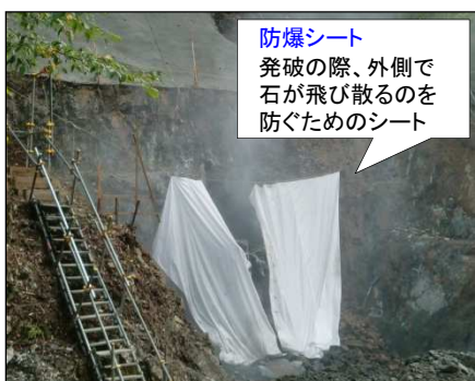
防爆シート 発破の際、外側で石が飛び散るのを防ぐためのシート