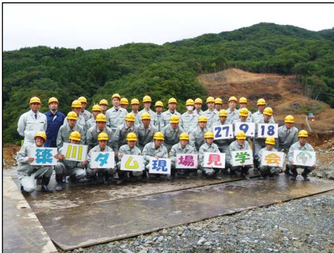
黒沢尻工業高校の皆さま