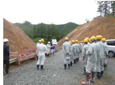
左岸工事用道路の説明中

実際の工事現場を見学した皆さまからは、「ダムの見学は初めてだったので楽しかった。」、「土木の仕事にさらに興味を持つことができた。」、「今回の見学を将来に役立てようと思う。」などの感想をたくさんいただきました。