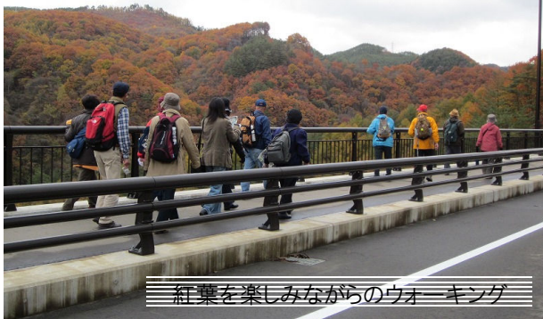
紅葉を楽しみながらのウォーキング