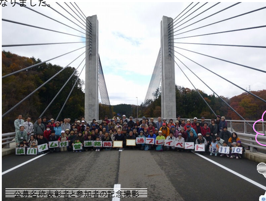
公募名称表彰者と参加者の記念撮影

また、現在行っている工事現場の見学をしていただき、工事に対する理解を深めていただく良い機会となりました。