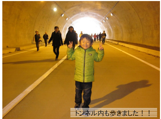
トンネル内も歩きました！！

イベントでは、約5kmのウォーキングのほかに、公募を行っていた「橋・トンネル名称」の表彰式を名称公募した築川大橋上で行い、イベント参加者の皆さんと記念撮影を行いました。