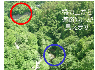
橋の上から道路や川が見えます