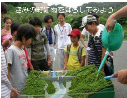
きみの町に雨を降らしてみよう