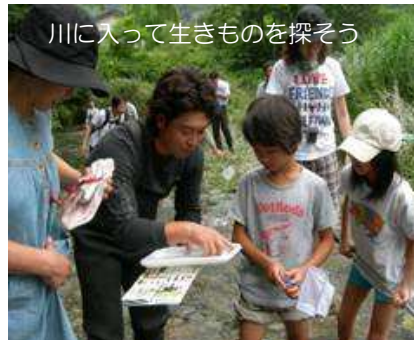
川に入って生きものを探そう