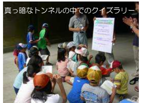
真っ暗なトンネルの中でのクイズラリー