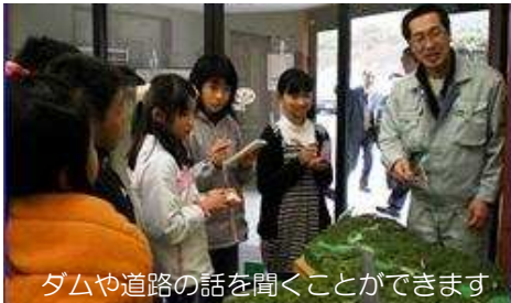
ダムや道路の話を知ることができます