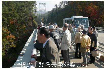
橋の上から景色を楽しむ