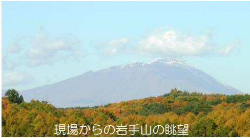
現場からの岩手山の眺望