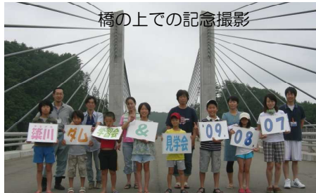
橋の上での記念撮影