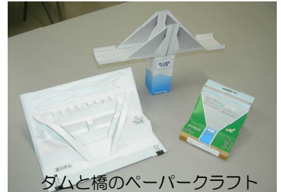
ダムと橋のペーパークラフト