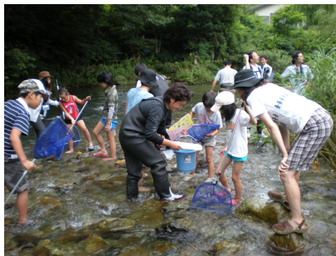
川の生きもの調査