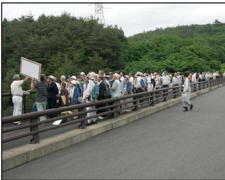
国道5号橋で説明 こんなに大勢の方が見学しました

今までにない大人数の見学会であったので、職員にとっても良い経験となりました。築川ダム建設事務所では、随時見学を受け付けておりますので、お気軽にお問い合わせください。