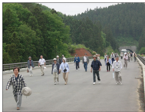
5～9号橋間（約1Km）を 皆さん、元気に歩きました