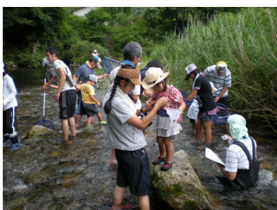
川の生きもの調査。全身びしょぬれで捕まえました。