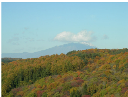
付替え国道5号橋からの景色 (岩手山が見えます)