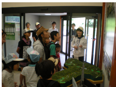
事務所での説明、みんな真剣に聞いています!!

参加した親子からは「川には行って楽しかった。」「普段見ることができない場所を見ることができた。」「来年もまた参加したい。」「などの感想をいただきました。