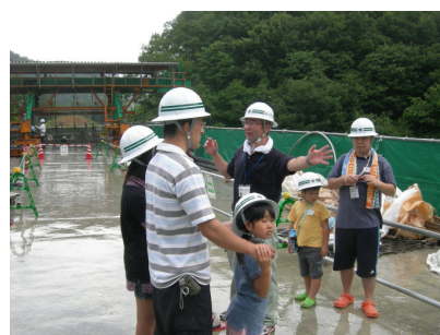
工事中の橋の現場で。ヘルメットが少し大きかったかな。