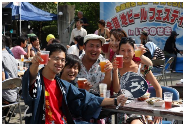
(※過去の地ビールフェスティバル)

全国の主な地ビールが一同に集まるイベントです。今年21回目を迎え、日本全国から200種以上の地ビールが集まります。