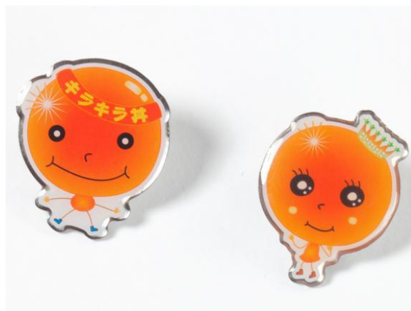
（「イクラン」(左)と「キララン」のピンバッジ）