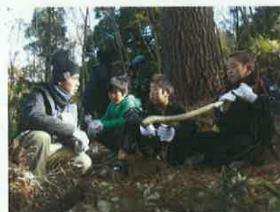
次の世代への恩送りを目指す