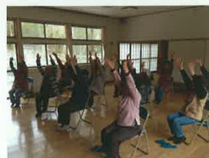
仮設住宅入居者健康運動教室