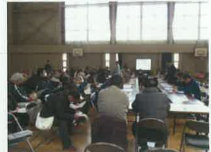
赤浜地域復興まちづくり懇談会

その後、復興事業が進んでいくにあたり、自分たちが住んでいる地域の復興について、自分たちで考えることとし、平成 23 年 8 月に「赤浜の復興を考える会」を結成した。