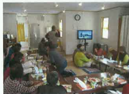
カラオケ大会の様子