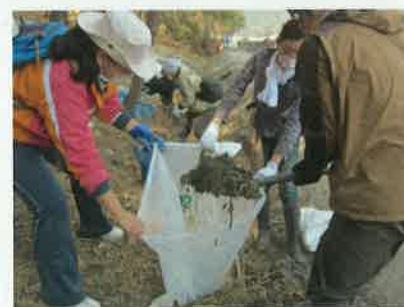
海岸清掃ボランティア