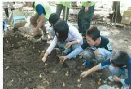
住民・ボランティアによる農園づくり

被災者とボランティアがともに憩う場所としてオープンした大槌「まごころ広場」。被災者・ボランティアの働く場の確保が課題となっていた時、地元住民の方々から休耕地の有効活用の提案やNPO団体等支援者からの設備等の支援があったことにより、「まごころの郷」づくりが始まった。