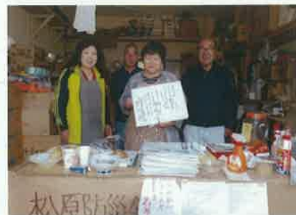
活動の様子（支援物資の受入①）

その後、平成14年に土砂災害があり、地区内で2名の犠牲者が出たことで、防災活動の必要性を感じ、本格的な活動を始めた。