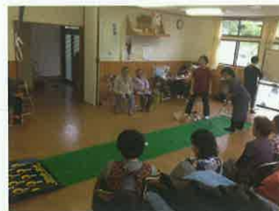
元気回復夢クラブ

高齢者の体力維持を図るため、毎週 1 回、市内の仮設住宅等にてニュースポーツやストレッチ教室を開催している。最近では仮設住宅以外からの出張要望も多く、毎日開催の月もあるほど好評。