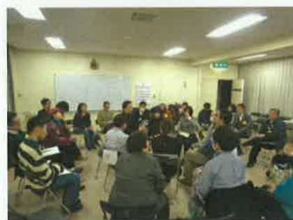
「ひと育て×まち育て大学」

「おらが大槌復興食堂」の運営、こども議会等の公共公益事業の実施に加え、外部への情報発信、地場産業やツーリズムの活性化、「ひと育て×まち育て大学」事業を通じた人材育成を行っている。