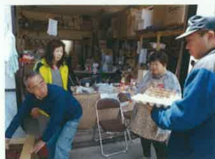
活動の様子（支援物資の受入②）

8月10日に避難所を閉鎖した後は、毎月10日に松原地区の住民や松原地区に避難された方を主な対象とした「松原会」を行い、バラバラになった住民の交流を図っている。