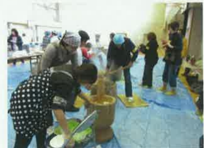
餅つきボランティア

結成当初は、取材の窓口、支援物資の受入等、赤浜地区の避難所運営を行っていた。現在は、復興計画に基づき、仮設住宅入居者の安心・安全管理、団地内のコミュニティ形成の応援、内陸等他市町村への避難者の名簿作成及び安否確認、さらに、地元赤浜への復郷支援や、仮設住宅入居期限切れに伴う移転先の用地確保交渉等、地域復興の最前線で行政と連携をとりながら事業を推進している。