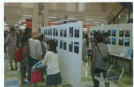
「復興カメラ」写真展