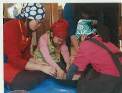
子供向けソバ打ち体験

全国からのボランティアに地域の課題を共に考えてもらうため、地域の漁師や農家と共に行動してにぎわい創出などを行う。