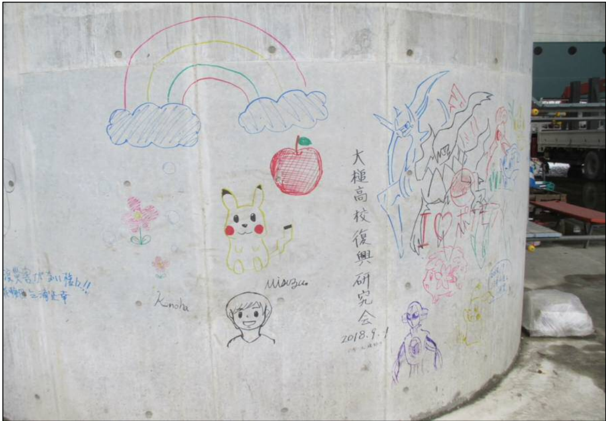
完成したメッセージ等