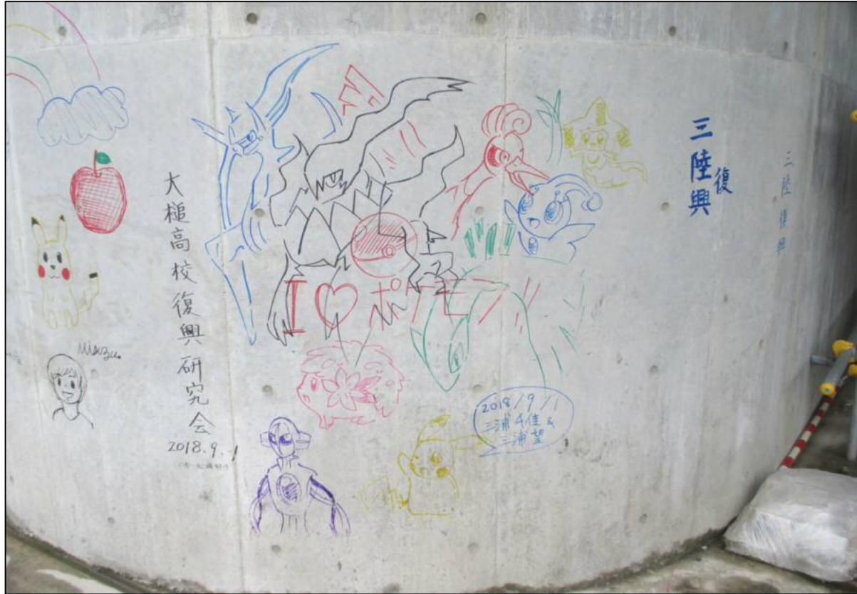
完成したメッセージ等