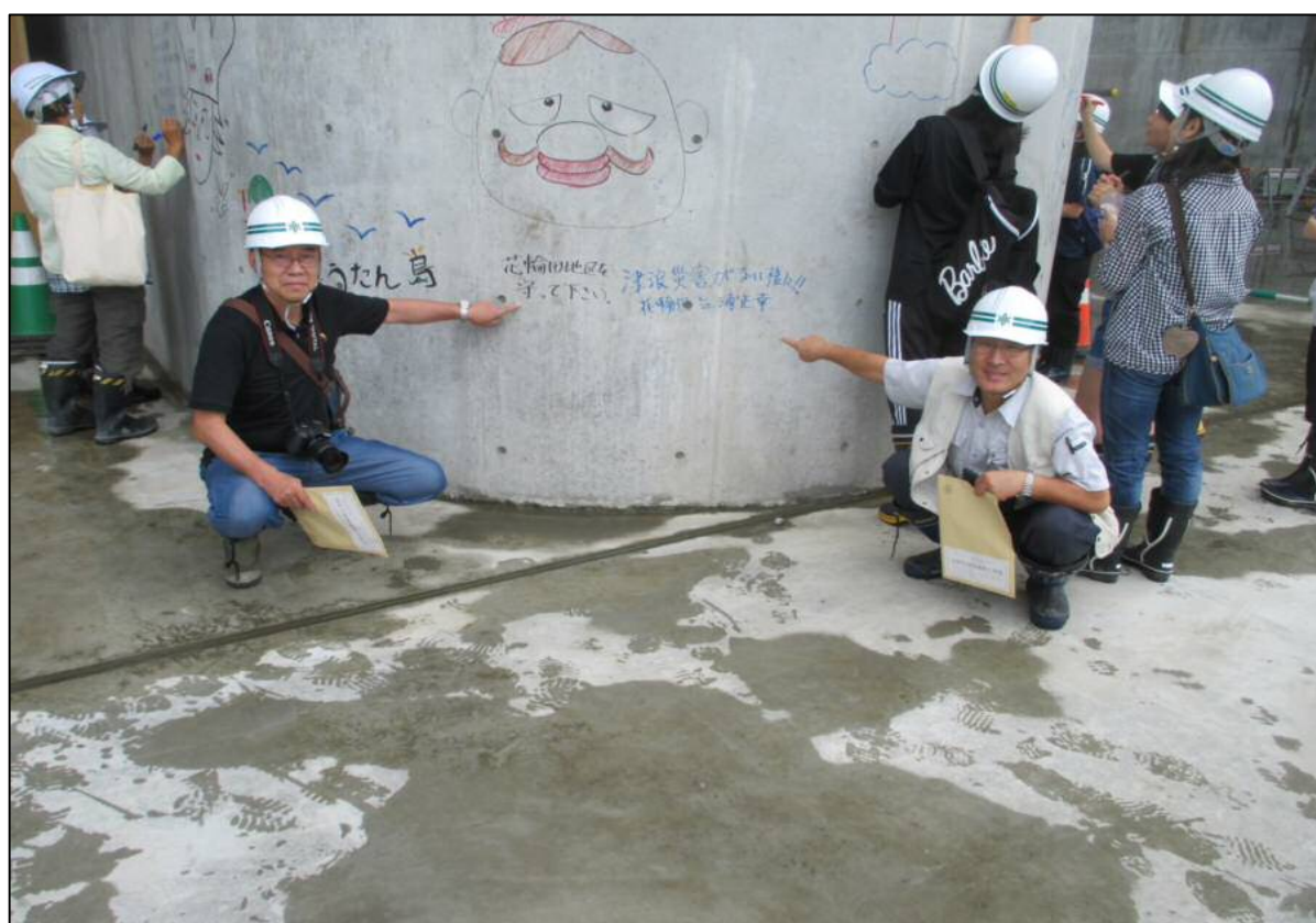
メッセージ等書込みの様子