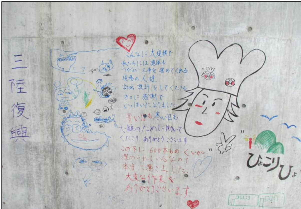
完成したメッセージ等