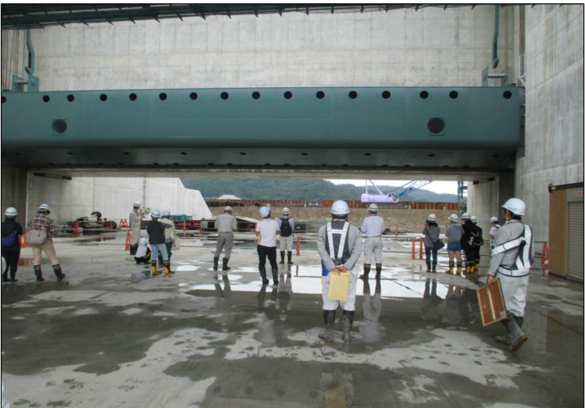
ゲート作動見学・設備工事説明の様子