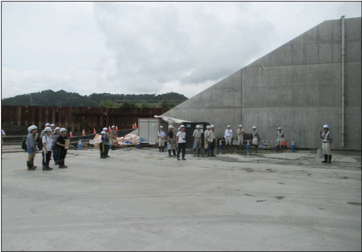
工事詳細説明の様子(土木JV)