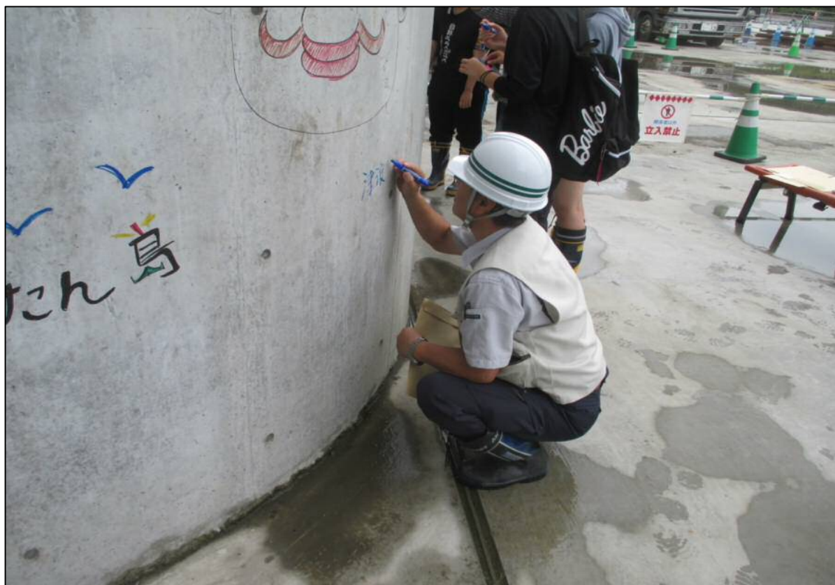
メッセージ等書込みの様子