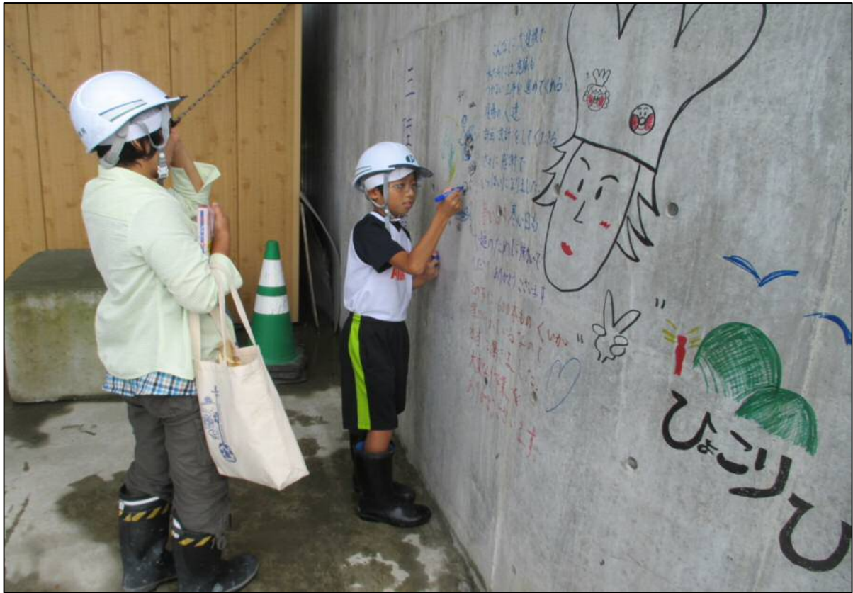
メッセージ等書込みの様子