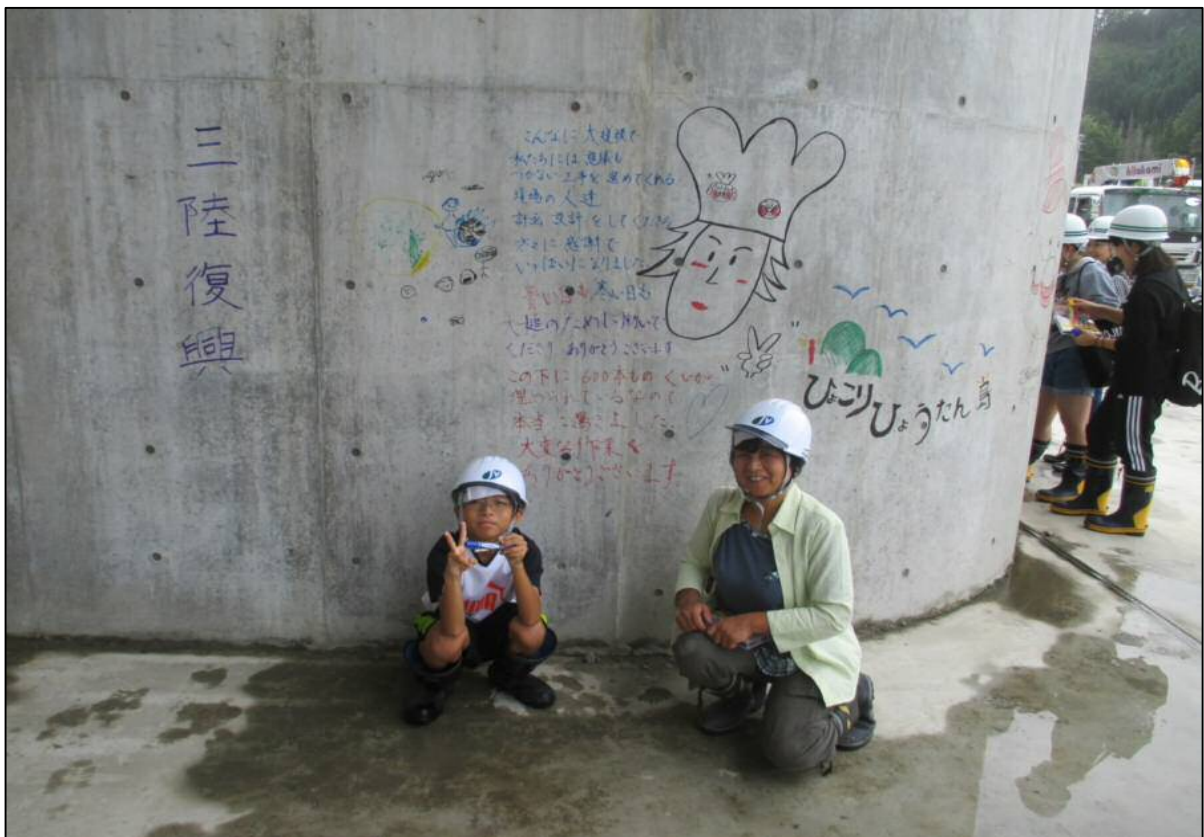
メッセージ等書込みの様子