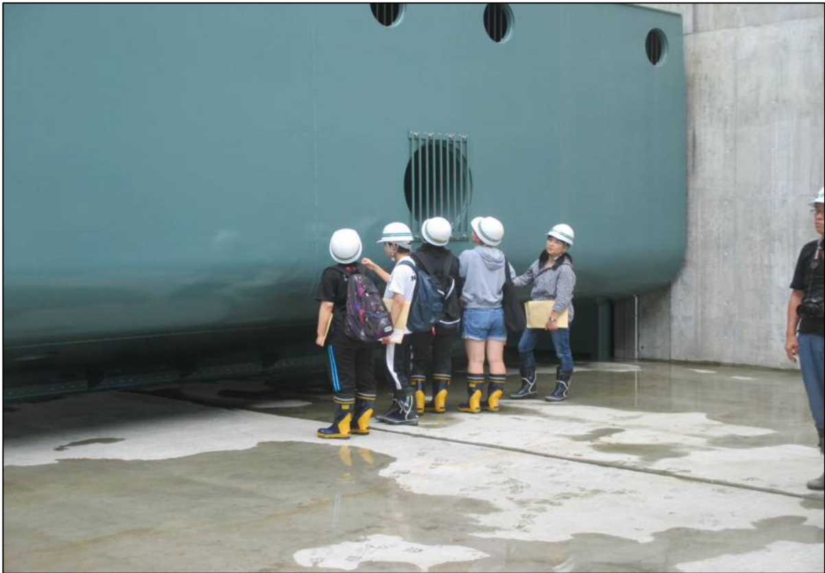
ゲート見学の様子