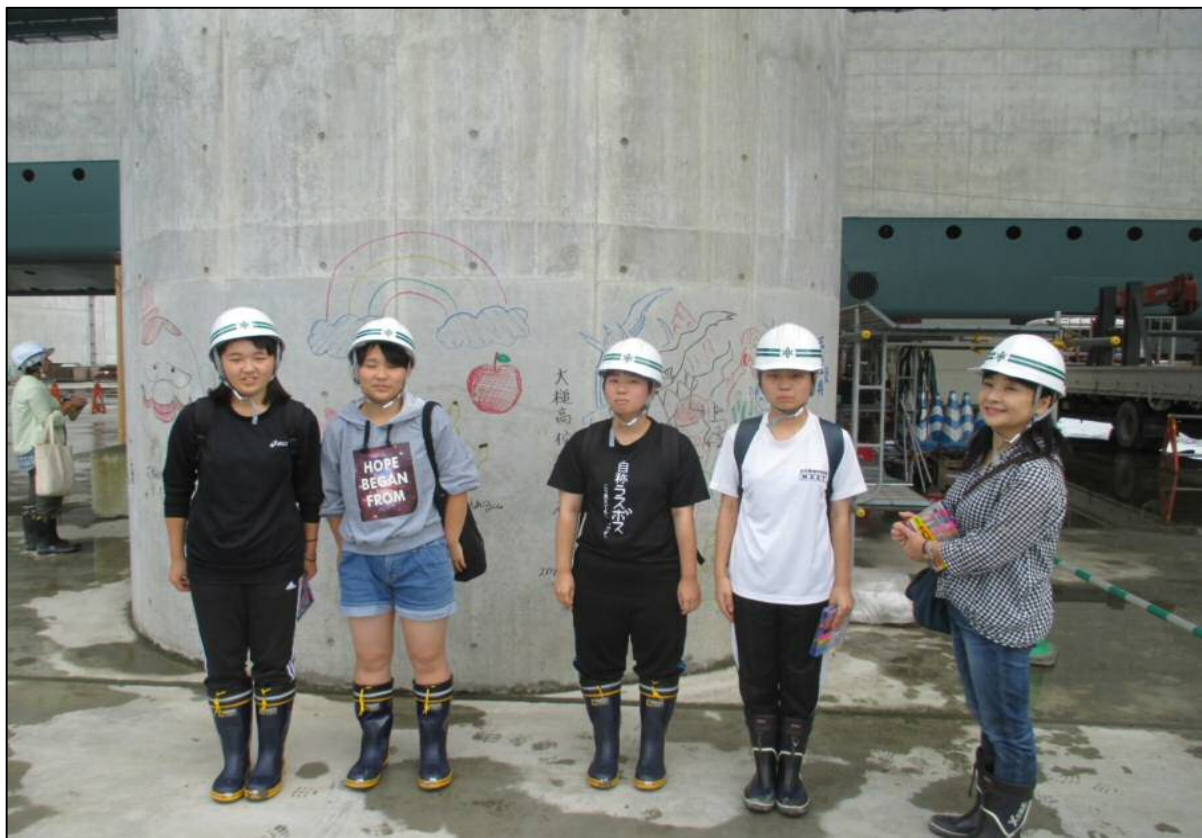
メッセージ等書込みの様子