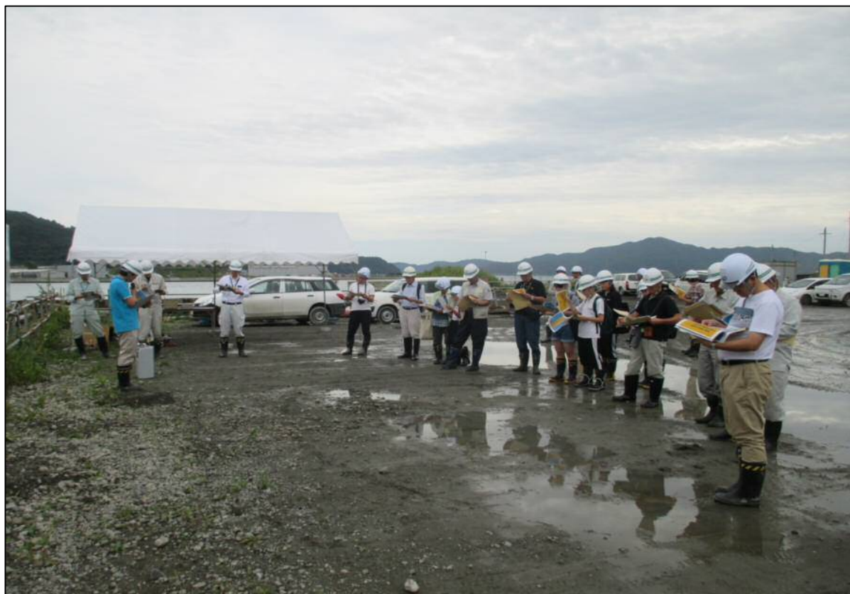
津波防災の考え方説明の様子