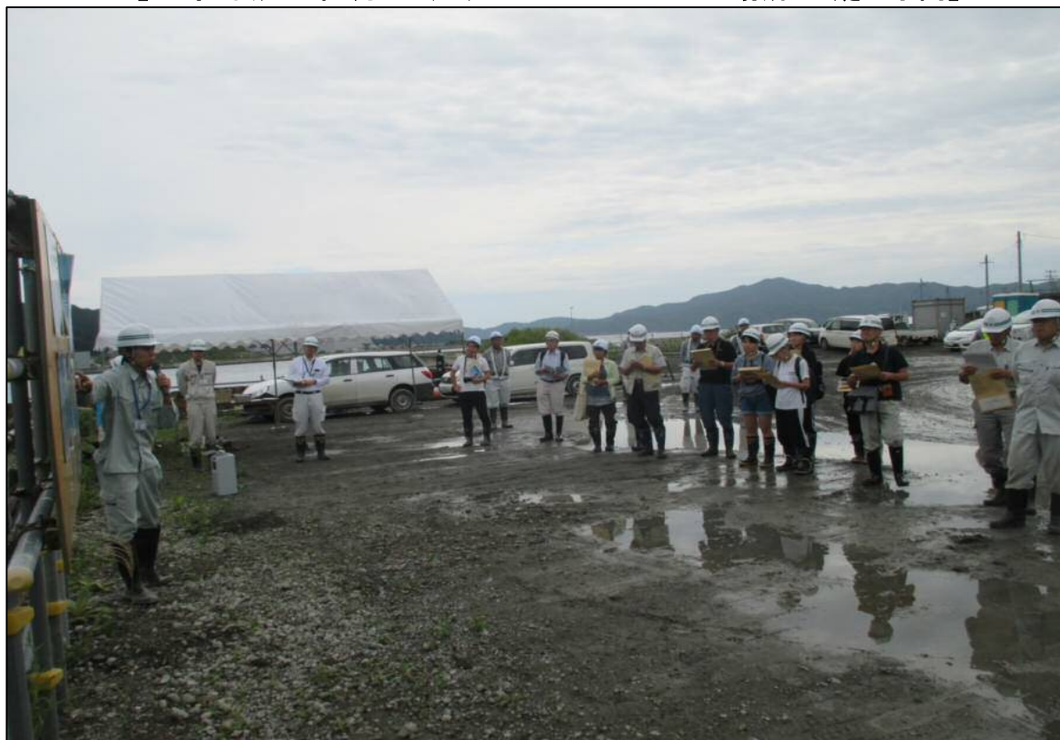
工事概要説明の様子