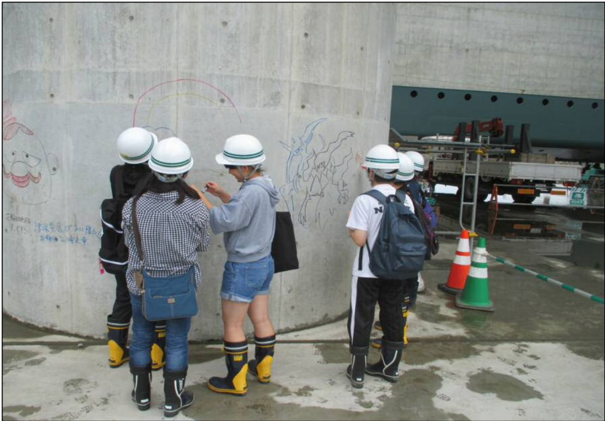
メッセージ等書込みの様子