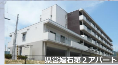
県営嬉石第2アパート