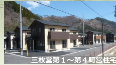
三枚堂第1~第4町営住宅