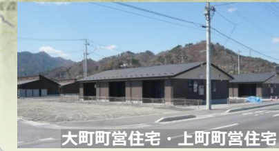
大町町営住宅・上町町営住宅