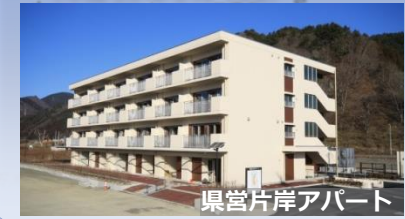
県営片岸アパート