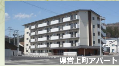
県営上町アパート