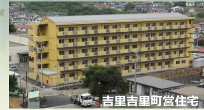
吉里吉里町営住宅