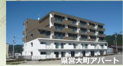
県営大町アパート