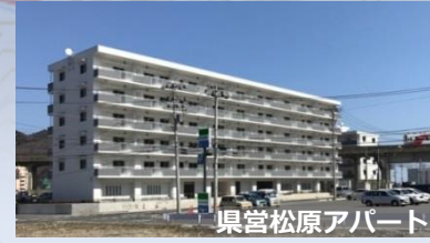
県営松原アパート