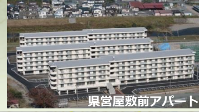
県営屋敷前アパート