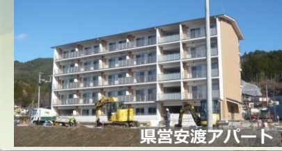
県営安渡アパート