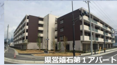
県営嬉石第1アパート