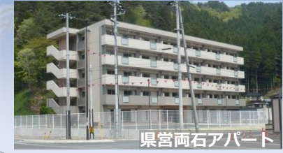
県営両石アパート