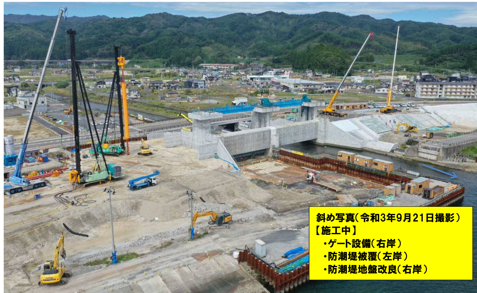
斜め写真(令和3年9月21日撮影) 【施工中】 ・ゲート設備(右岸) ・防潮堤被覆(左岸) ・防潮堤地盤改良(右岸)