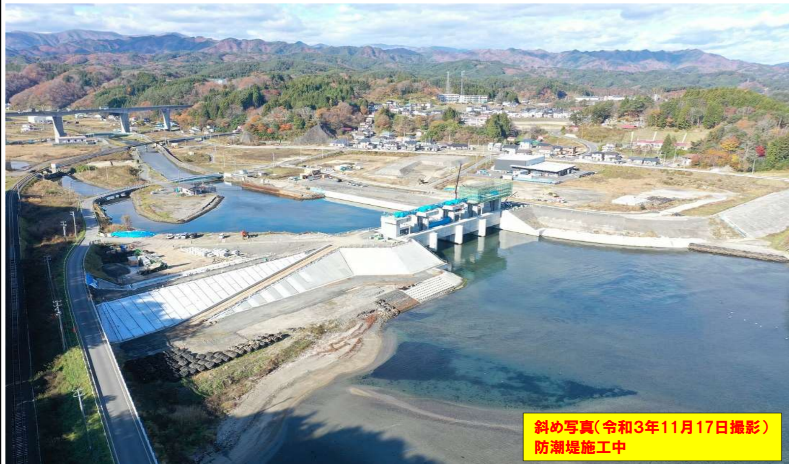
斜め写真(令和3年11月17日撮影) 防潮堤施工中