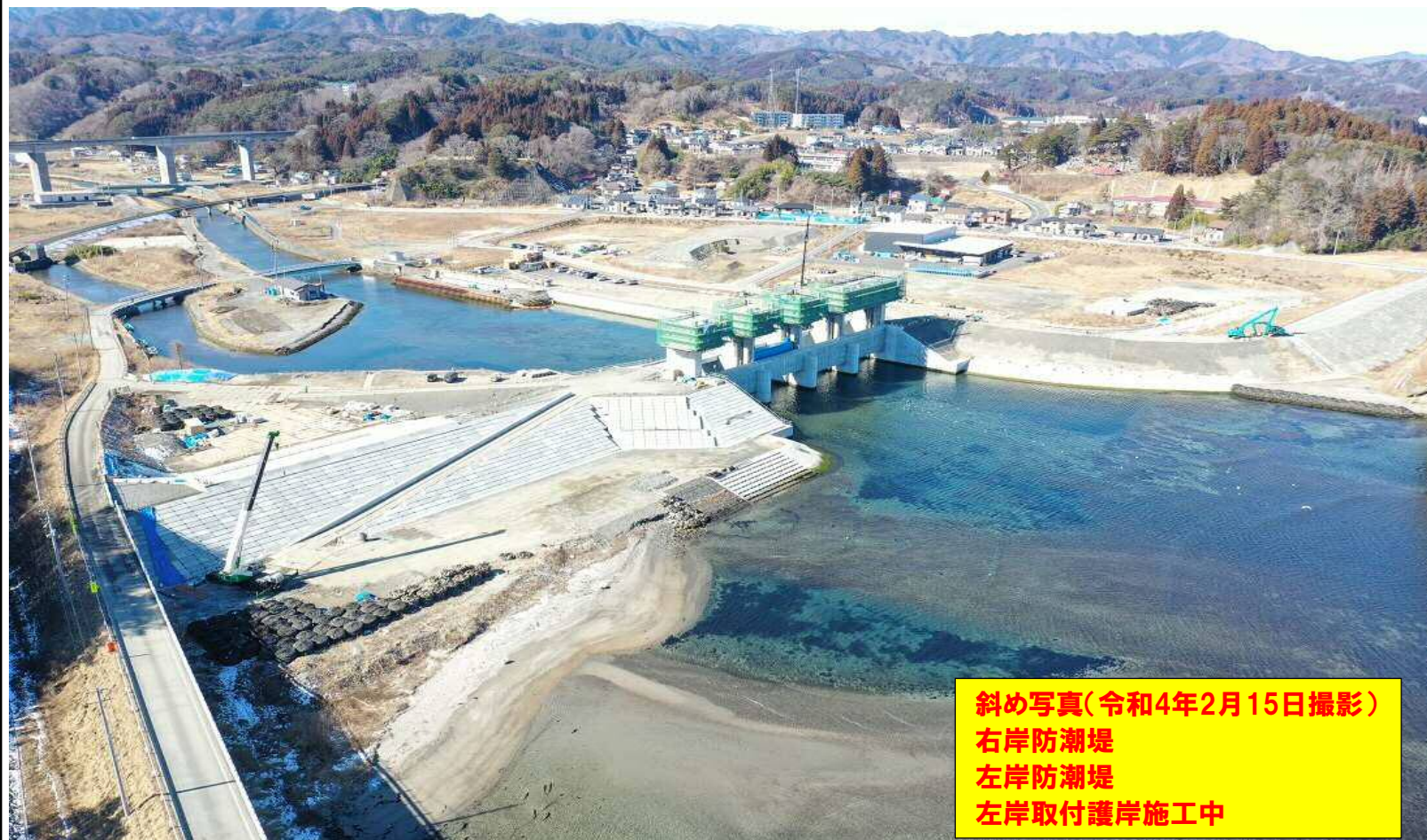
斜め写真(令和4年2月15日撮影) 右岸防潮堤 左岸防潮堤 左岸取付護岸施工中