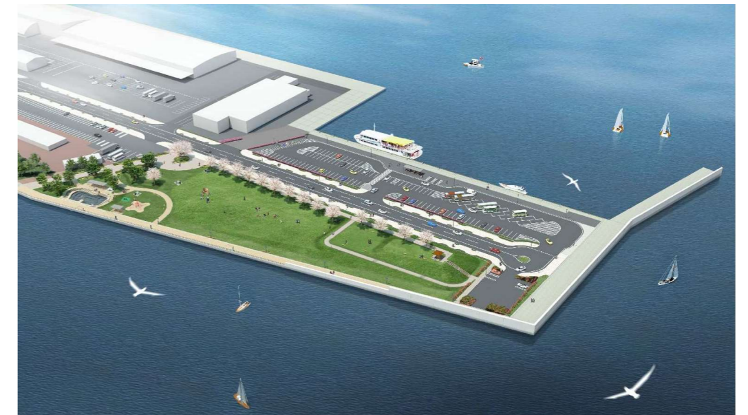
※現時点での完成イメージであり変更となる場合があります。