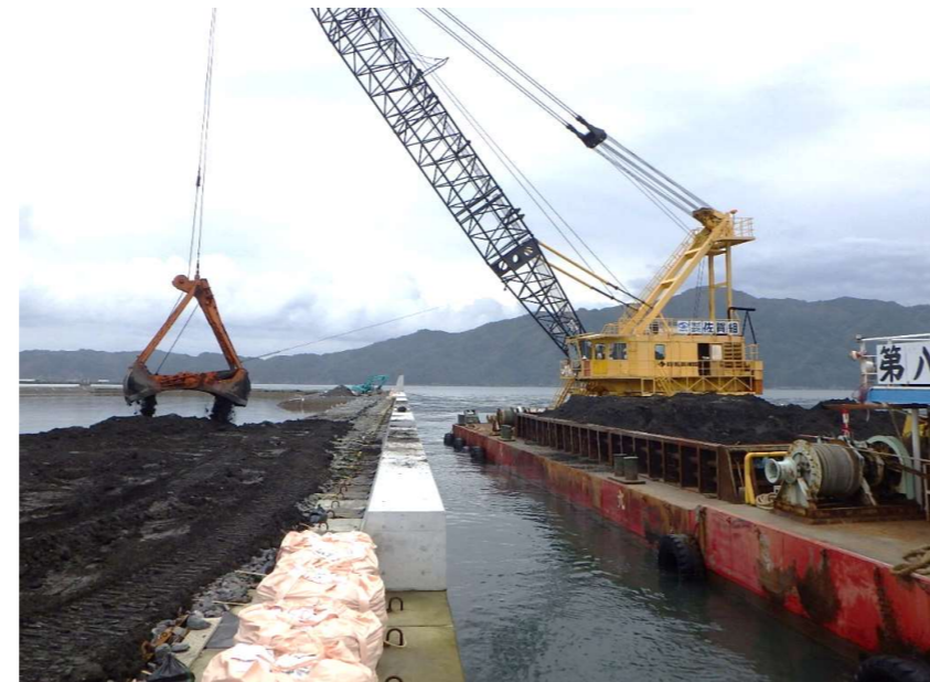
現在は埋め立てのための土砂投入をしています。写真は令和2年10月末撮影