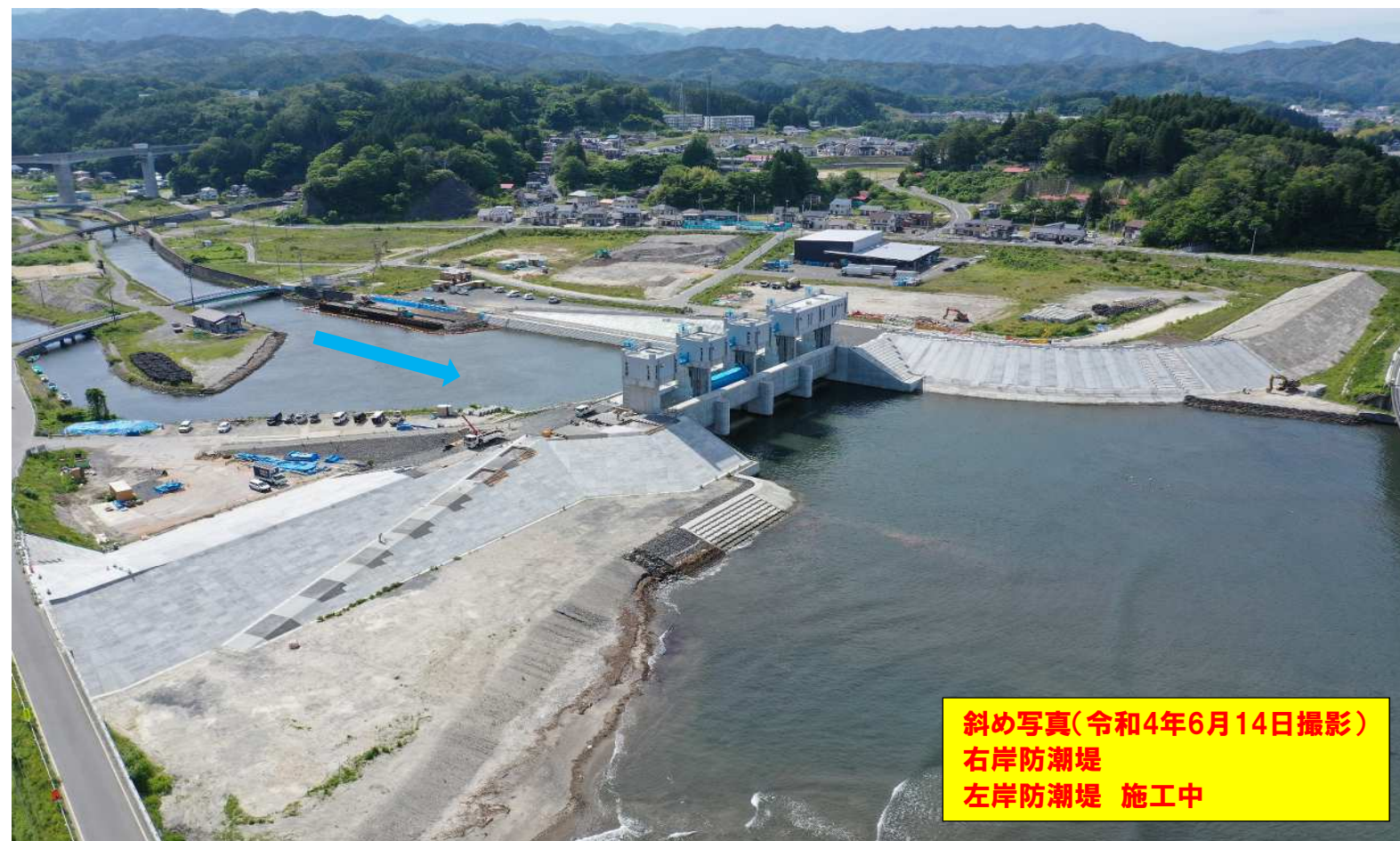
斜め写真(令和4年6月14日撮影) 右岸防潮堤 左岸防潮堤 施工中