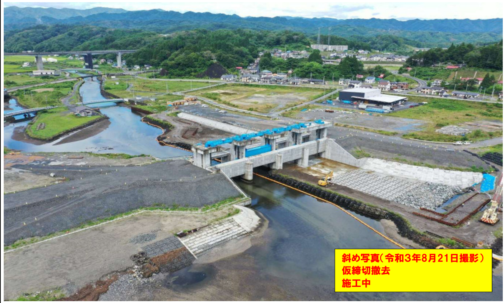
斜め写真(令和3年8月21日撮影) 仮締切撤去 施工中