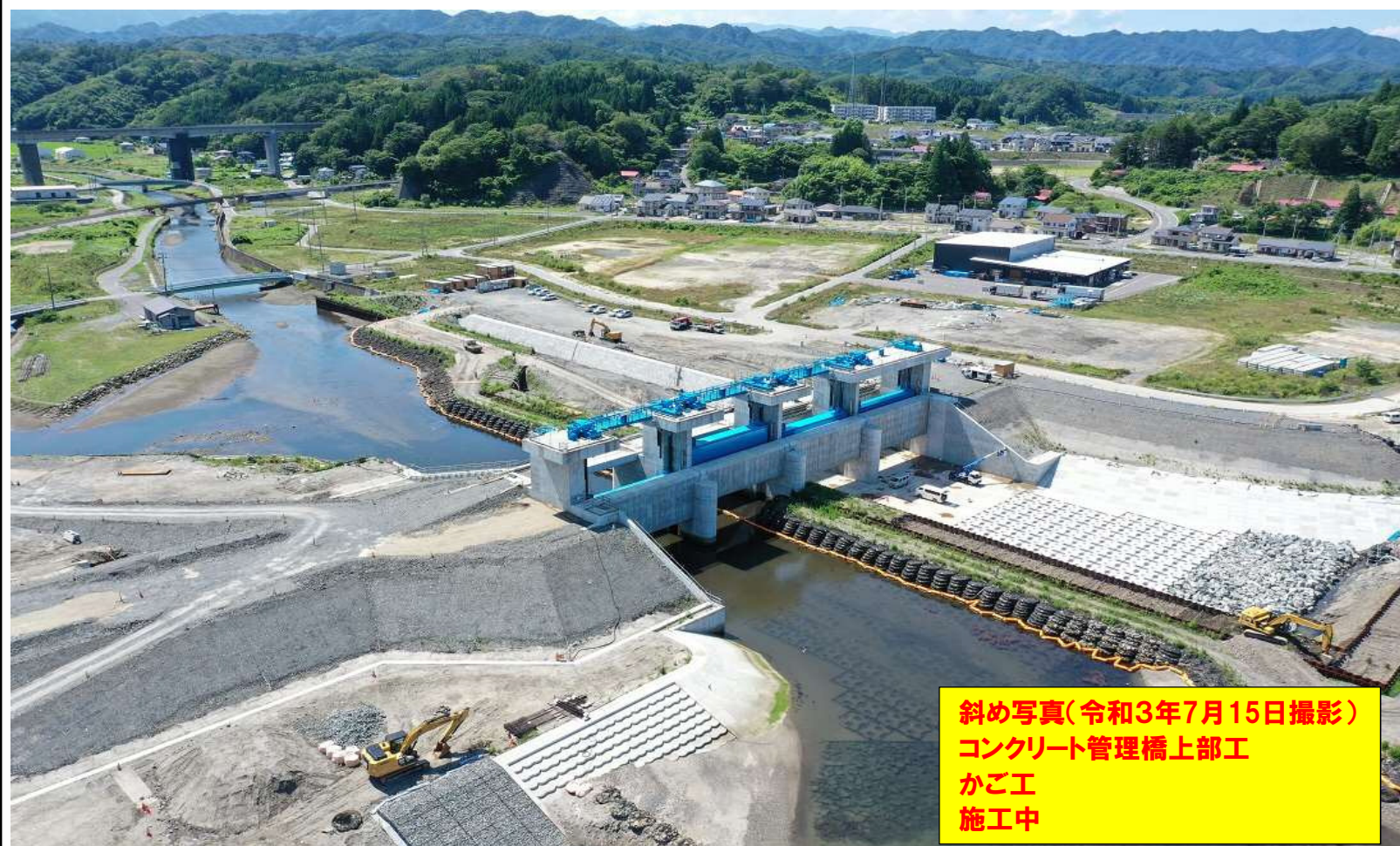
斜め写真(令和3年7月15日撮影) コンクリート管理橋上部工 かご工 施工中