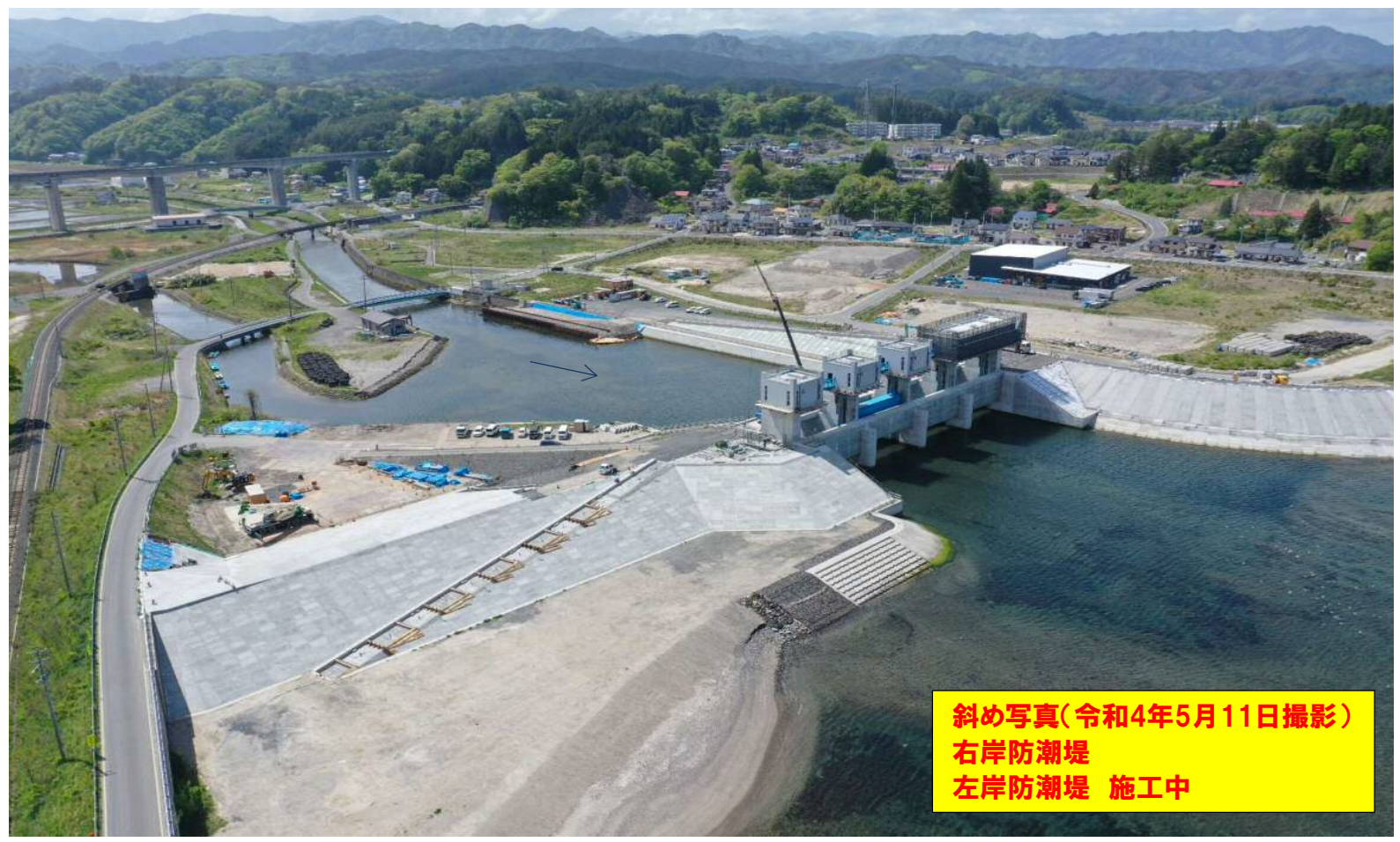
斜め写真(令和4年5月11日撮影) 右岸防潮堤 左岸防潮堤 施工中