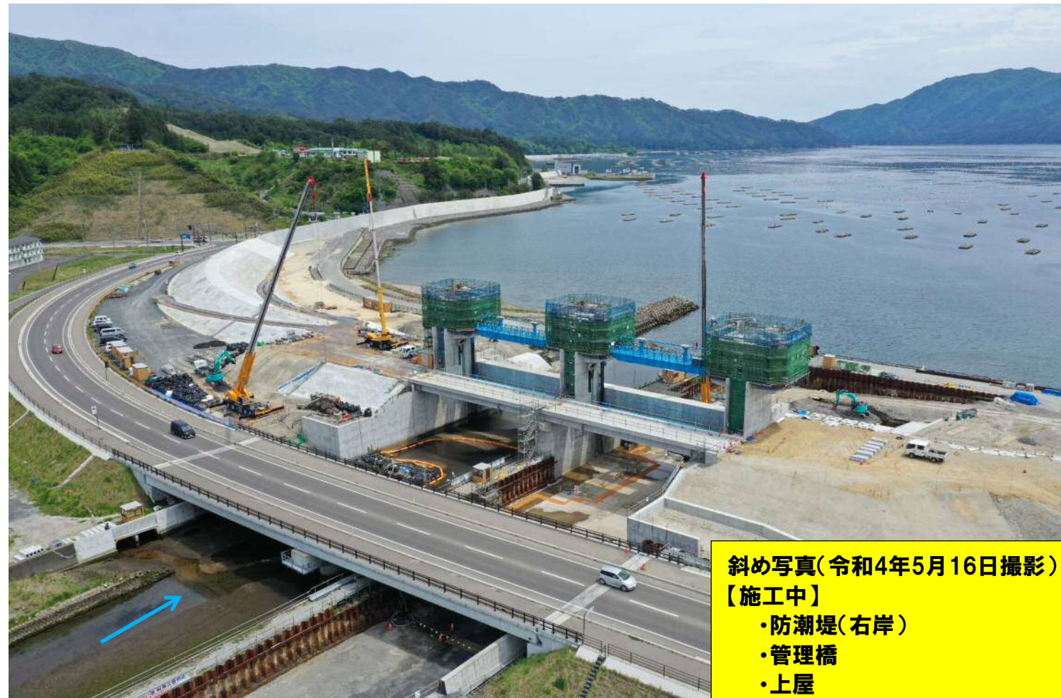
斜め写真(令和4年5月16日撮影) 【施工中】 ・防潮堤(右岸) ・管理橋 ・上屋