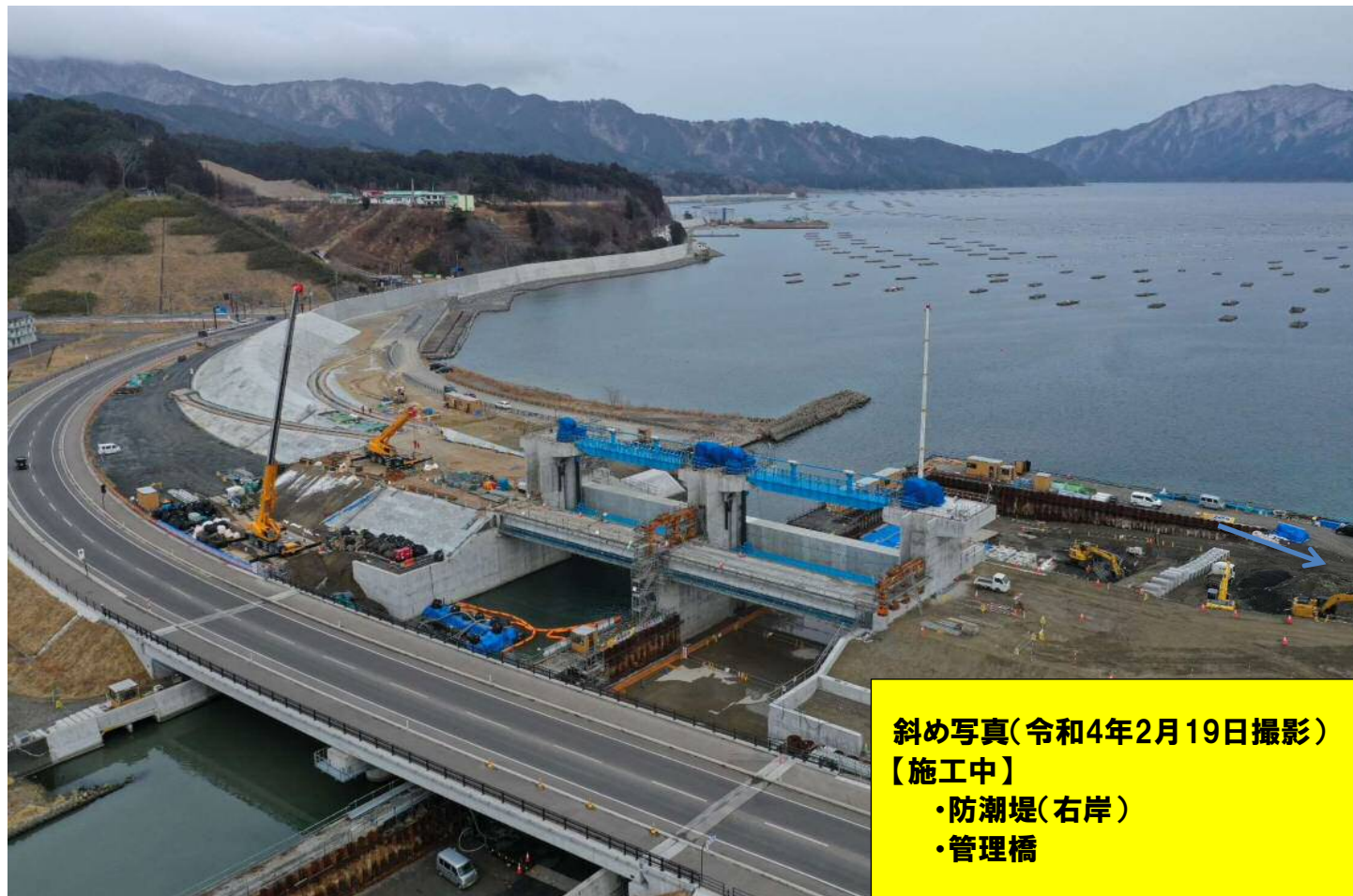
斜め写真(令和4年2月19日撮影) 【施工中】 ・防潮堤(右岸) ・管理橋