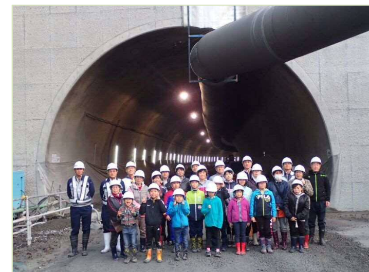
トンネル坑口(岩泉側)で集合写真！