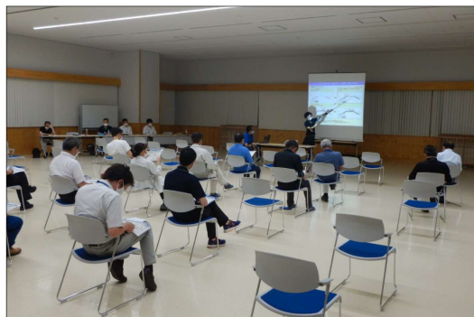
7月6日 小本津波防災センター

令和4年7月6日、7日に、 中島地区の国道嵩上げ工事に関する説明会 を開催しました。中島地区(1,758メートル)は、平成28年台風第10号の被害を受けたことから、 国道455号の嵩上げによる対策工事 を行っており、 工事周辺地域の方々に工事の現状や今後の予定、通行規制の概要を説明 しました。