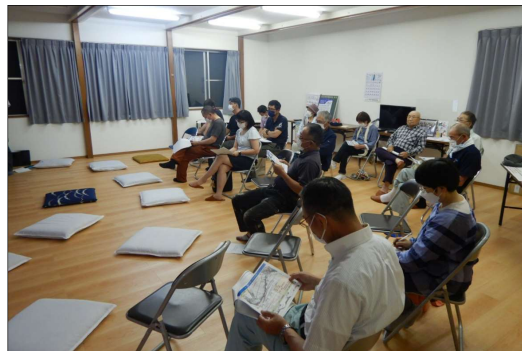
7月7日 中島地区集会所

質疑では、国道の代替として農道を活用した場合の通行規制に関するものや、工事情報の地元への共有についてなど、様々な意見が出されました。頂いた意見を基に、施工計画の見直しを行うとともに、工事情報について広報などを活用してお知らせします。