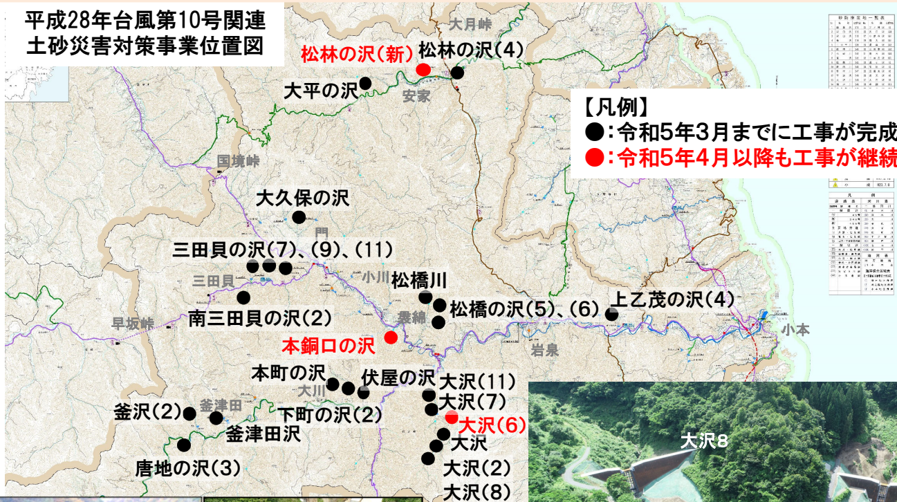
平成28年台風第10号関連 土砂災害対策事業位置図

今年度の全箇所完成を目指して工事を進めてきたところですが、下記の3箇所は令和5年度以降の完成となる見込みです。