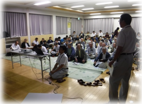
全体説明の様子（撮影平成29年9月8日）

説明会では、「 安家の原風景を幾らかでも残してほしい 」や「 筆界未定地の解消に時間を要し、事業が遅れることの無いようにしてほしい 」といった意見のほか、各箇所における 雨水排水の計画に関する質疑 。及び「 被災前に川に降りて利用していたので、階段工や坂路を設置してほしい 」や「 道路の嵩上げにより宅地からのアクセスが悪くなることから、嵩上げ等により不便にならないようにしてほしい 」といった意見をいただきました。