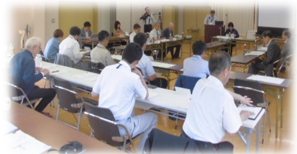
協議会の様子（撮影H29.6.20）

河川や動植物に係る有識者と併せ、地域の代表や商工会、消防団等の方に委員に就任いただき、安家川河川改修計画について、専門的な意見や地元目線での意見等をいただいているものです。