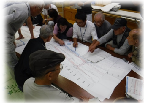
個別説明の様子（撮影平成29年9月8日）