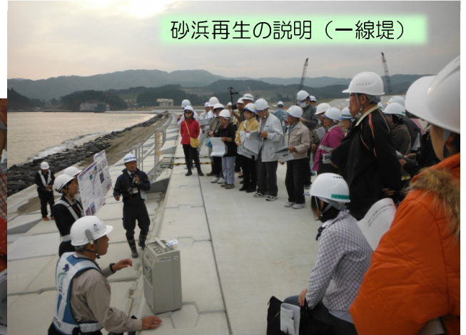
砂浜再生の説明（一線堤）

参加された方は、復興現場の写真を撮ったり、たくさん質問をするなど、感心の高さがうかがわれました。