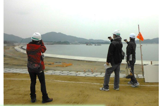
気仙川水門の状況

高田海岸では、参加者の皆さんに被覆ブロック（防潮堤の表面を覆うブロック）にメッセージを記入していただきました。このブロックは、今後、防潮堤（二線堤）に設置されます。