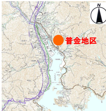
(承認番号 平28情使、第307-GISMAP37585号)