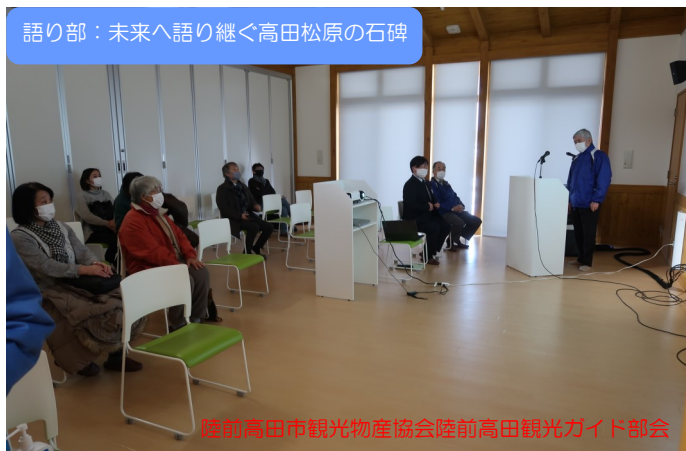
陸前高田市観光物産協会陸前高田観光ガイド部会