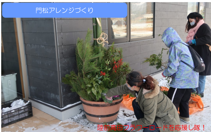
門松アレンジづくり