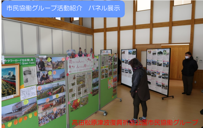
高田松原津波復興祈念公園市民協働グループ