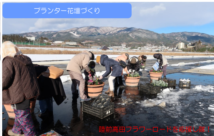
プランター花壇づくり