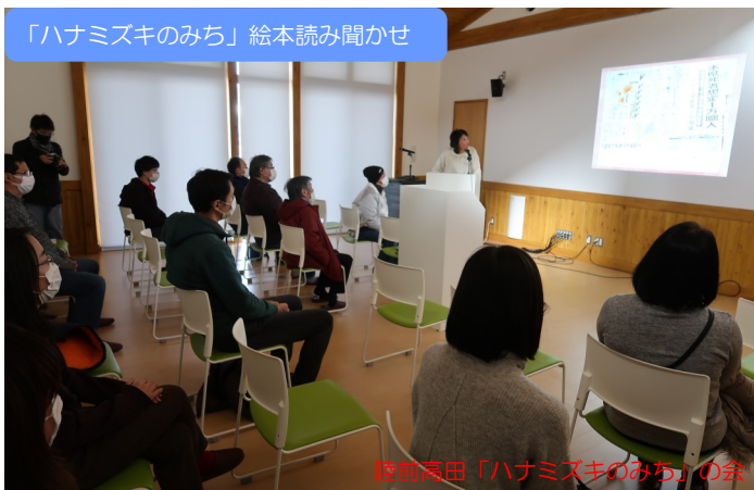
陸前高田「ハナミズキのみち」の会