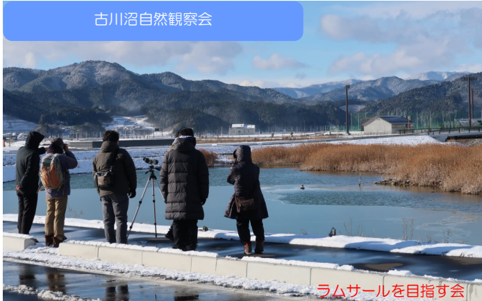
ラムサールを目指す会