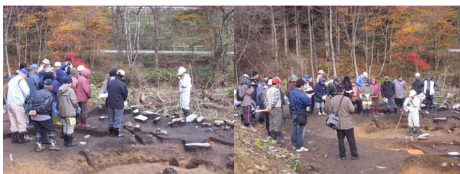
（発掘調査現地公開の様子）