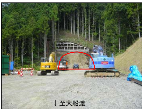
《津付トンネルの現在の状況》