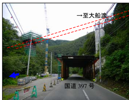
《一ノ渡大橋の現在の状況》