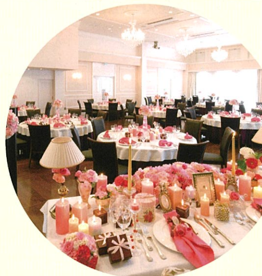
モルトン迎賓館八戸