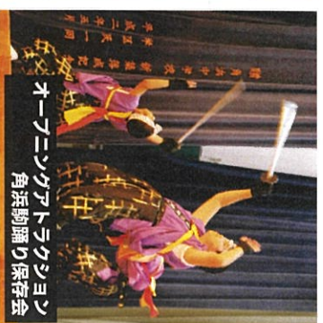
オーブニングアトラクション 角浜駒踊り保存会