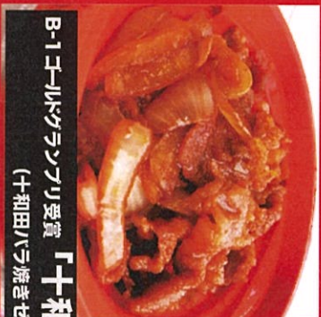
B-1エントランス入り受賞 「十和田バラ焼き」試食できます!! (十和田バラ焼きゼミナール特設ブース)