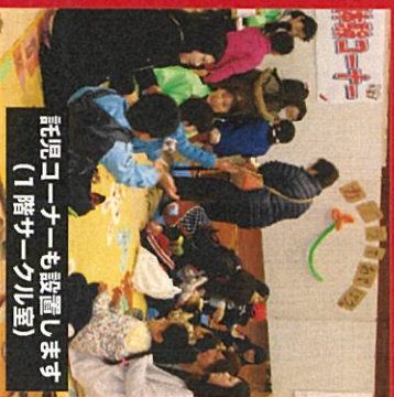
託児コーナーも設置します (1階サークル室)