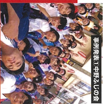
事例発表①中野ふじの会