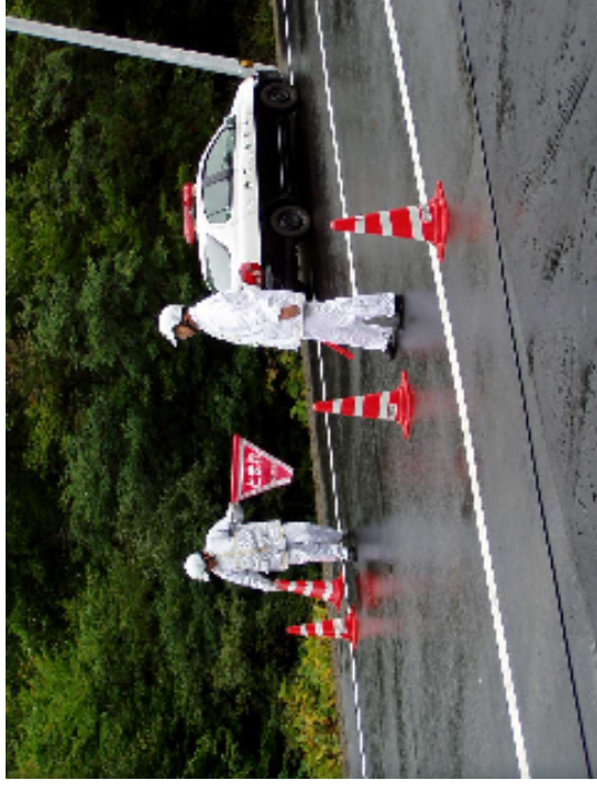
交通規制訓練 (通行規制の措置を実施します)