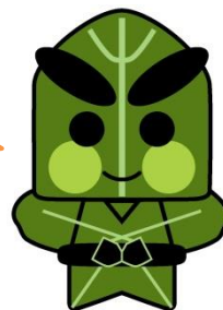
久慈地方寒締めほうれんそう PRキャラクター 寒次郎

※I・Uターン者の場合は交通費を助成いたします（交通費の1/2以内、上限交通費2万円）。 事前にお問い合わせください。