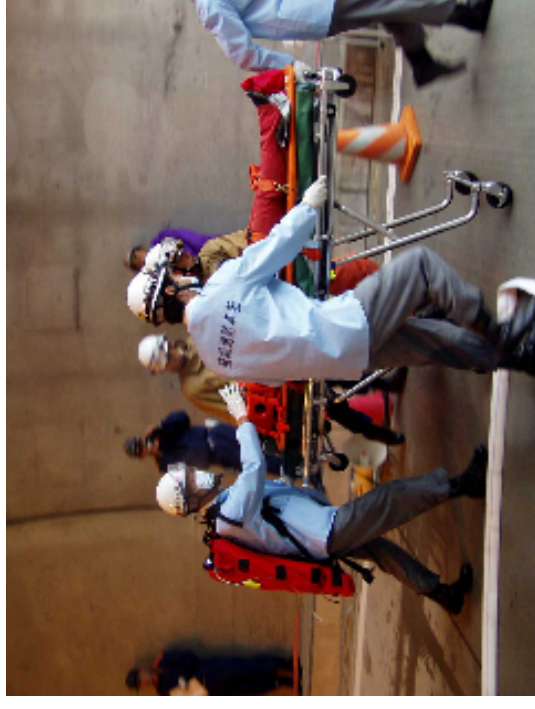
救急救助訓練 (医療機関への搬送を行います)