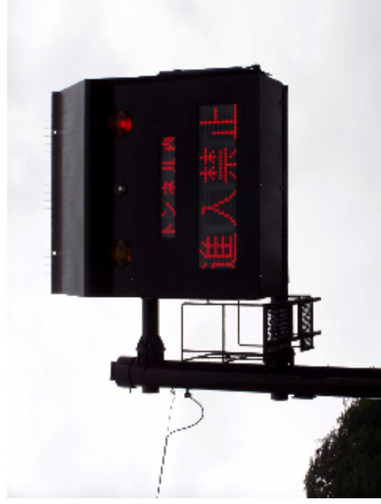
防災設備作動訓練 (非常警報設備の動作確認を行います)