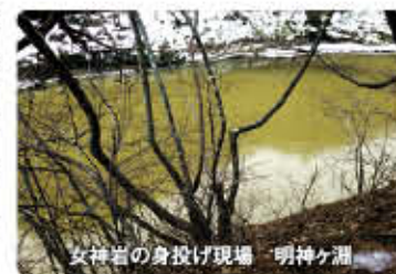
女神岩の身投げ現場 明神ヶ淵