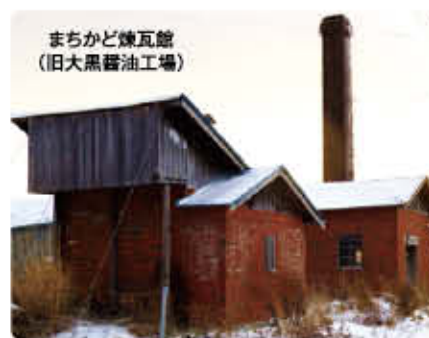
ましかど煉瓦館 (旧大黒醤油工場)