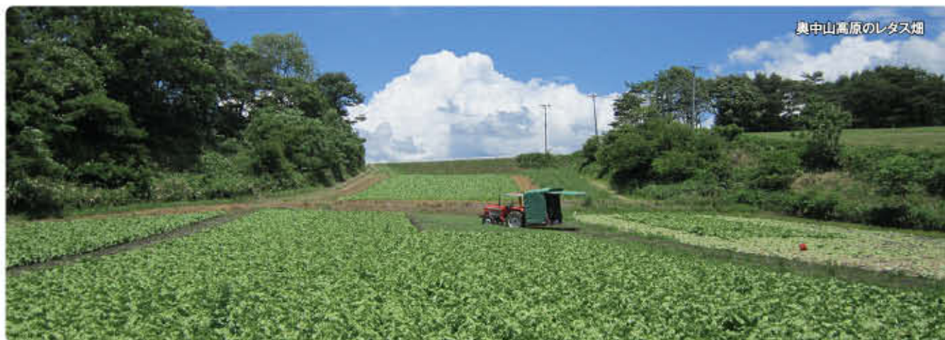
奥中山高原のレタス畑