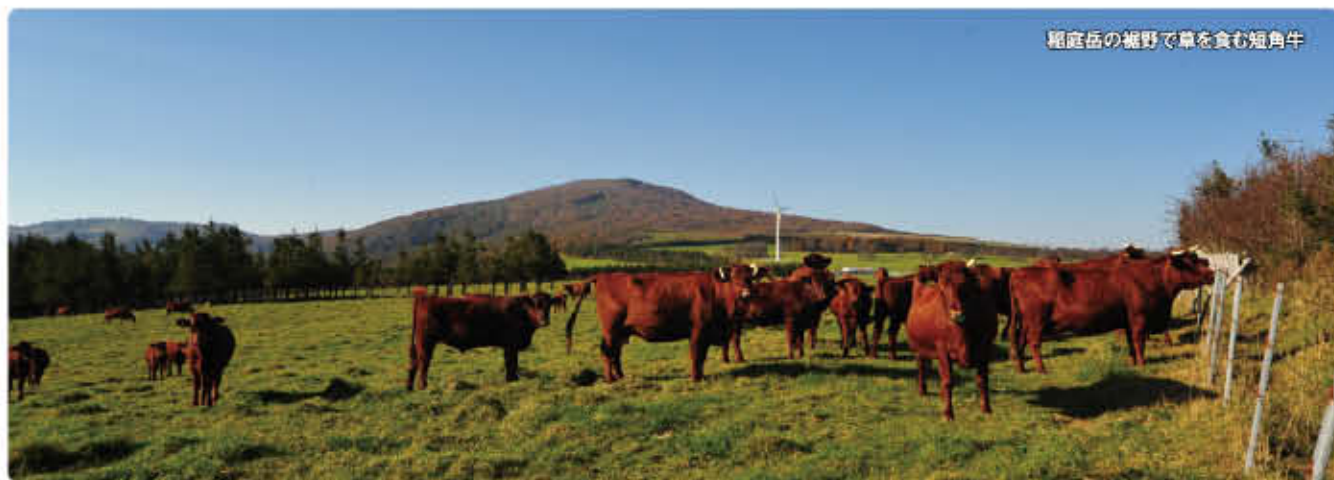
稲庭岳の裾野で草を食む短角牛