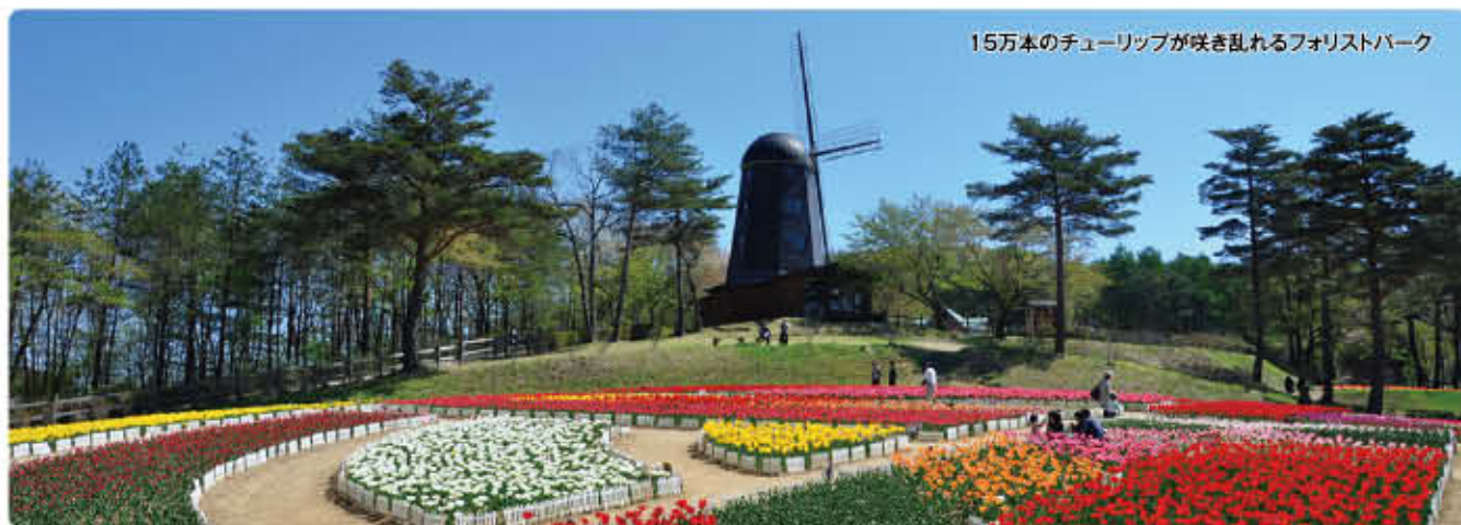
15万本のチューリップが咲き乱れるフォリストパーク