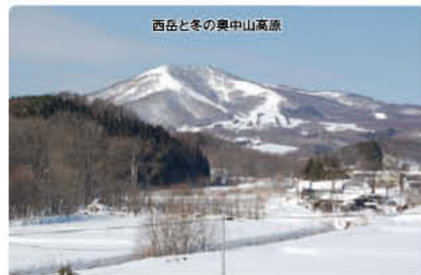
西岳と冬の奥中山高原

冬は零下18度にも達する厳寒の中、わずか6坪の掘立小屋で過ごすという生活でした。食べ物も乏しく、栄養失調から結核で倒れるものも多く、乳児死亡率は実に90%にも上ったそうです。