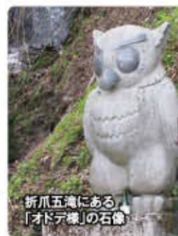
折爪五滝にある「オドデ様」の石像

伝説によると、名主の神棚に立ち、明日の天気からなくし物、縁談、病気まで村人からの相談を占い、ピタリと当てていました。ある日、自分の目の前にお金の詰まった賽銭箱があることに気付き、「ドデン、ドデン」と叫びながら森の中に飛んで行ってしまったそうです。