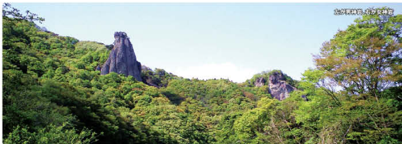
左が男神岩、右が女神岩