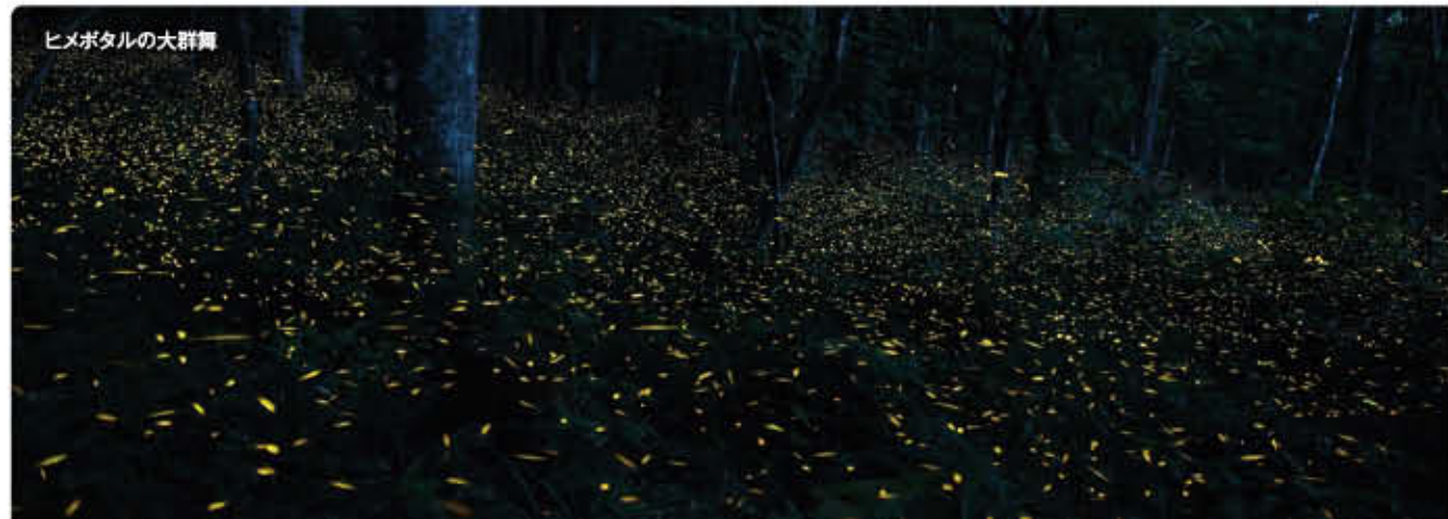
ヒメボタルの大群舞

ただ、ヒメボタルの生態についてはまだまだ不明な点が多く、現在調査が進められています。