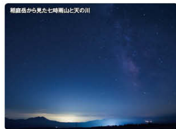
稲庭岳から見た七時雨山と天の川

四季折々の大自然の恵みが感じられる稲庭岳。ぜひお出でになって、大自然を満喫してください。