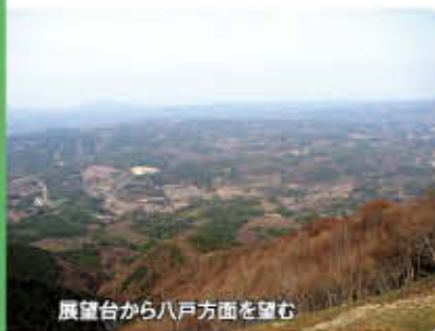
展望台から八戸方面を望む

折爪活断層の活動によって形成されたと考えられており、東側から見上げると険しい形をしています。