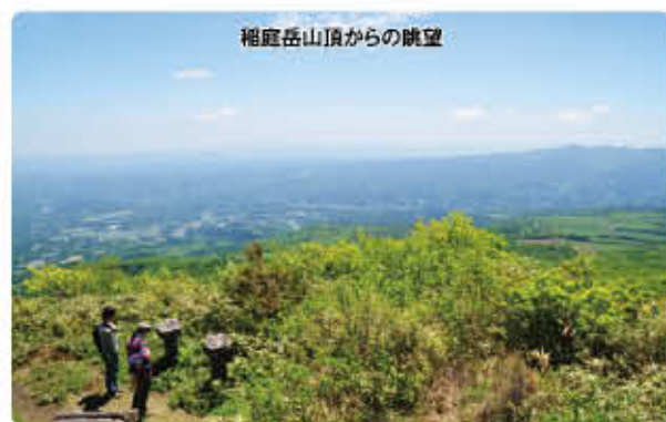
稲庭岳山頂からの眺望

山頂の展望台からの眺めは正に絶景!折爪岳、西岳、岩手山、八幡平等の岩手県内の山々はもちろん、八戸の海も見わたすことができます。