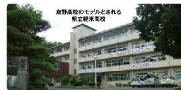
鳥野高校のモデルとされる 県立軽米高校

「週刊少年ジャンプ」に連載中で、アニメ化もされた超人気マンガ「ハイキュー!!」。物語では宮城県が舞台とされていますが、マンガに登場するシーンから、軽米町が舞台ではないかとの噂が…。