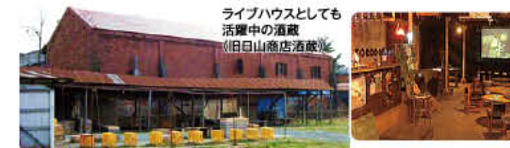
ライブハウスとしても活躍中の酒蔵 (旧山崎酒蔵)

ものです。それに対し軽米町のは戦後の約10年間に集中して建てられたという全国でも珍しい貴重な建物群です。今でもライブハウスなどとして使われている酒蔵など現役で活躍している建物もあります。