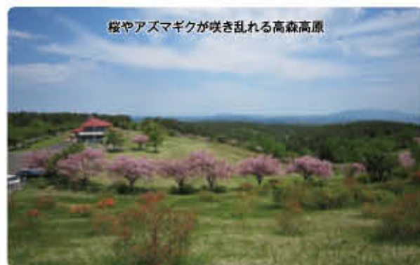
桜やアズマギクが咲き乱れる高森高原