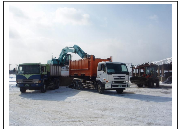
図 1 : 廃棄物の積込状況 (H26. 2. 14)