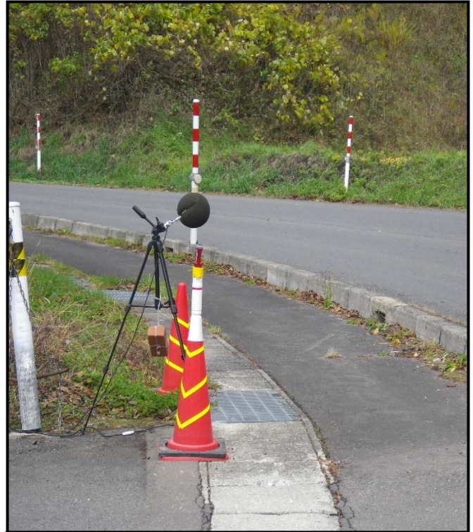
図2：11月9日運動公園付近の測定の様子