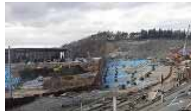
平成 23 年 11 月 9 日 県境現場