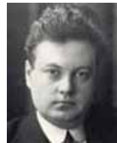
シーベルト (放射線人体影響の研究)