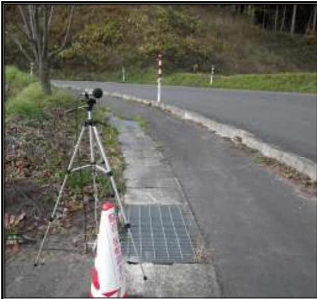
11月10日 運動公園付近の測定の様子

なお、昨年度までは、自動車騒音等の基準値を超過して計測されたことはありませんでした。