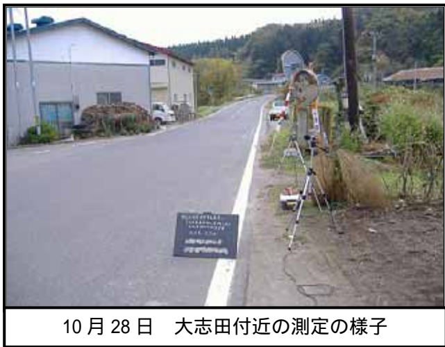
10月28日 大志田付近の測定の様子

結果については、今後開催される原状回復対策協議会で報告されるほか、本紙上でもお知らせする予定ですが、例年、環境基準等の基準値をクリアしています。