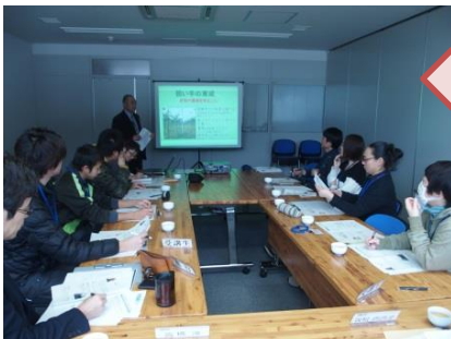
先輩農家の事例研修 (2017年)

※2回目以降の時期・場所は変更する場合があります。詳細が決まりしだい、別途ご案内いたします。