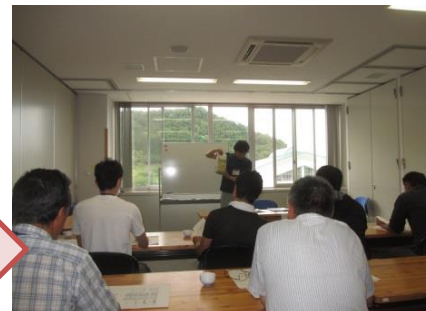
病害虫防除に関する研修 (2015年)