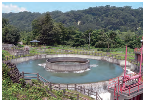
【写真】円筒分水（徳水園）