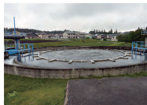
【写真】円筒分水（南北分水工）

上流の岩洞第一発電所で発電した後、写真左上の岩洞第二発電所の水槽を経由し、農業用水管橋（写真中央）を流下して下流の円筒分水へ送水されています。