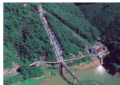
【写真】岩洞第二発電所

かんがい期間中は、発電と農業用あわせて最大12.0m 3 /sの水を取水しています。使用中は水中に設置され、水位の変動に応じて自動的に開度を調整しています。