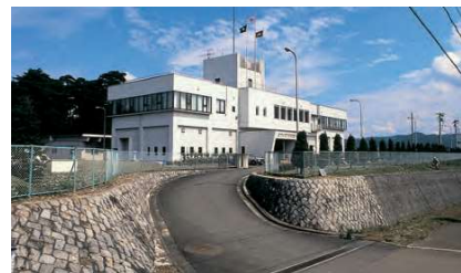
第一浄水場 (旧北上工水) 管理棟