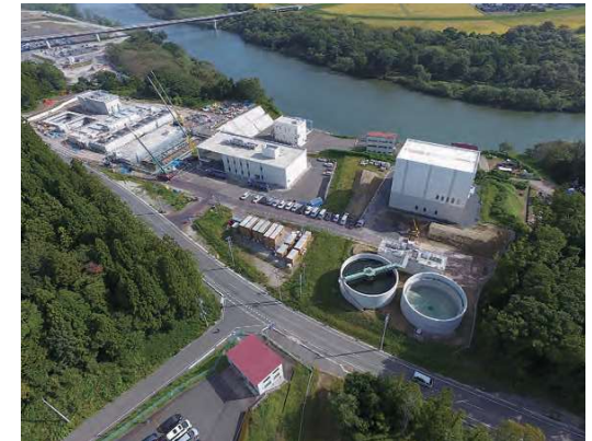
新北上浄水場建設中の様子