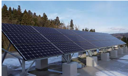
県南施設管理所に10kWの太陽光発電設備を設置しています (平成26年設置)。発電した電気は全て施設内で使用され、電力使用に伴う環境負荷低減に貢献しています。