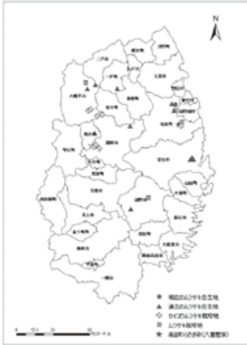
図3 ムラサキの栽培地・自生地とセイヨウムラサキの拡散状況 (2012年11月13日現在)

は間違いない。我々は、野生のムラサキから採取した種子を利用して苗生産に取り組んできたが 14) 、この方法で作出した苗 (図5) は、紫根染や薬用 15) などの材料としても利用が期待できる。我々以外に野生の種子を起源として栽培を行っているかどうかの有無について情報収集と確認調査を行った結果、岩泉町の森子親一氏、八幡平市の小船清悦氏が自生地の種子をもとに栽培を行っていることが判明した。そこで2011年11月10日に八重樫義一郎氏・八重樫由吏氏の案内により岩泉町安家江川地区でムラサキの栽培を行なっている森子氏を訪ねて調査を行った。その結果、森子氏は30年前に自宅正面にある山からムラサキを採取して栽培していることが分かった (図6)。自生地の状況については、おそらく残っていないだろうと証言している。毎年種子を採取して発芽を行っているが、発芽するのはごく