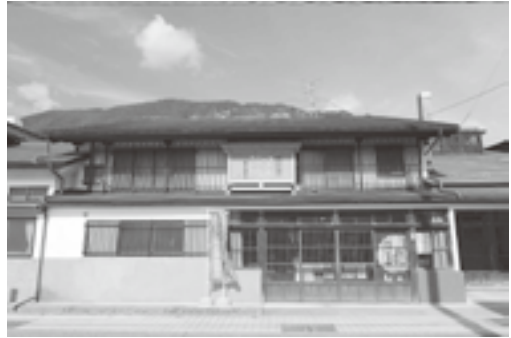
図1 安政元年(1854年)創業、県内有数の老舗として知られる岩泉町泉金酒造 撮影日:2012年10月9日

日本では、聖徳太子が冠位十二階で最上位の「徳」を示す色として定めて以来、「紫」に