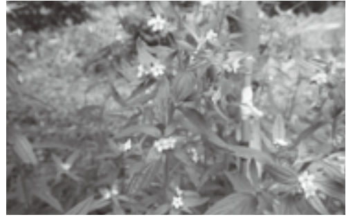
図4 セイヨウムラサキ 撮影日：2012年6月25日 (表3サンプル番号5と同じ個体)

は間違いない。我々は、野生のムラサキから採取した種子を利用して苗生産に取り組んできたが 14) 、この方法で作出した苗 (図5) は、紫根染や薬用 15) などの材料としても利用が期待できる。我々以外に野生の種子を起源として栽培を行っているかどうかの有無について情報収集と確認調査を行った結果、岩泉町の森子親一氏、八幡平市の小船清悦氏が自生地の種子をもとに栽培を行っていることが判明した。そこで2011年11月10日に八重樫義一郎氏・八重樫由吏氏の案内により岩泉町安家江川地区でムラサキの栽培を行なっている森子氏を訪ねて調査を行った。その結果、森子氏は30年前に自宅正面にある山からムラサキを採取して栽培していることが分かった (図6)。自生地の状況については、おそらく残っていないだろうと証言している。毎年種子を採取して発芽を行っているが、発芽するのはごく