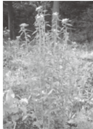
図5 八重樫家の栽培地に定植1年後に開花したムラサキ 撮影日：2012年6月4日 (表3サンプル番号2と同じ栽培地)