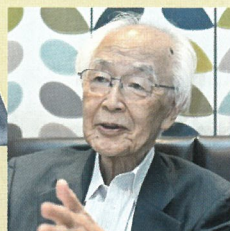
3月18日(火) 柳田 邦男 先生

ノンフィクション作家 航空機事故、医療事故等のドキュメント 評論を現場に足を運んで多数出版