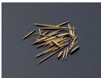
【スプリングプローブ】