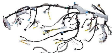
【自動車用ワイヤーハーネス】

ワイヤーハーネスは自動車のあらゆる箇所に電気信号を伝える電線の集合体で人間の身体に例えると「血管や神経」と同じで、「ワイヤーハーネス」の存在が自動車の動作に非常に大切な役割を担っています。1台の自動車に使われる電線の本数は1,000本以上、総電線長は1,500m～2,000mにもなり、電子機器を多数搭載した現代の自動車では重要な構成部品の一つです。