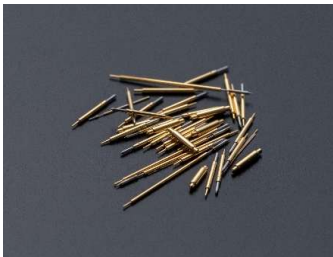
【スプリングプローブ】