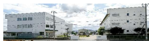
【盛岡ヒロセSER株式会社 九戸事業所】