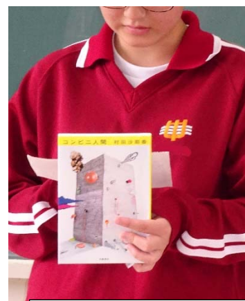
ビブリオバトルの様子