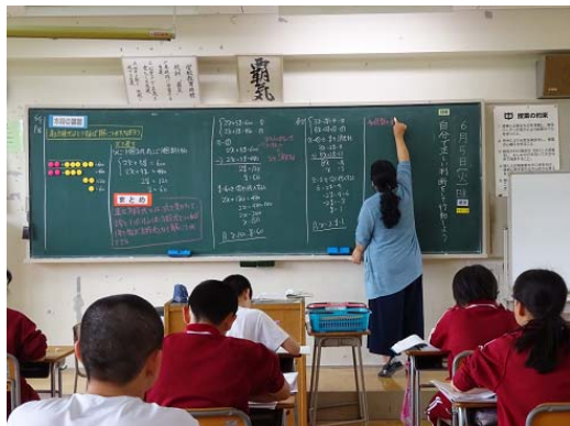
用語を使って説明する 連立方程式の授業（数学）