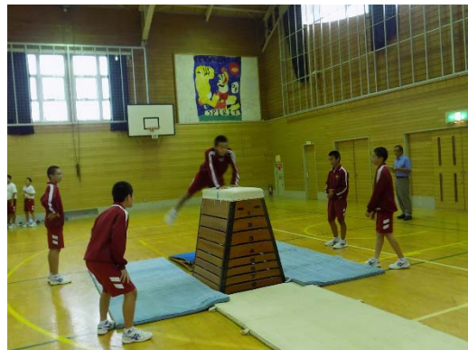
学び合いながら、より良い跳び方を 探る、跳び箱の授業（保健体育）