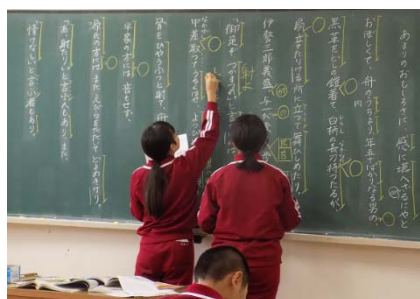
予習プリントとほぼ同じ黒板で学習する(国語)

(2) 小中連携ファミリースクールで作成した「学習の手引き」を活用し、4月に全校生徒で家庭学習の手引きを確認した。また、年2回の「家庭学習強化週間」に小中連携で取り組んだ。