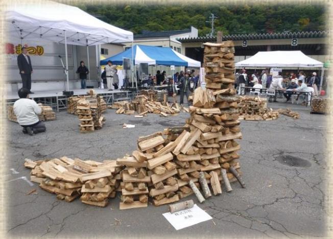
団体の部 完成作品