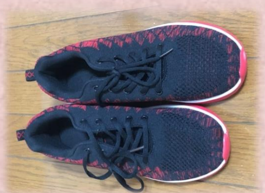
新調したランニングシューズ