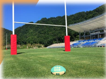
釜石鶴住居復興スタジアム