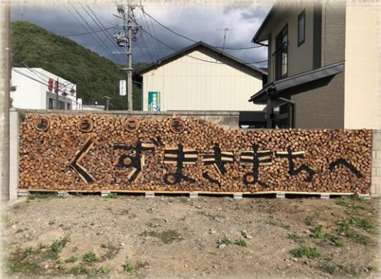
町役場で初めて作成した薪棚