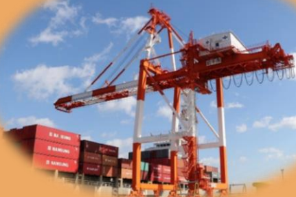
ガントリークレーン (大型コンテナ船への荷役 対応が可能となった施設)