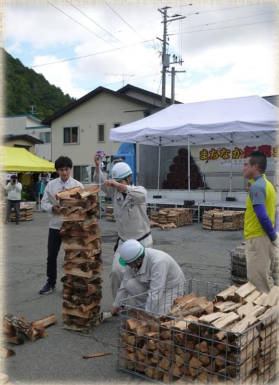
個人の部 計測の様子