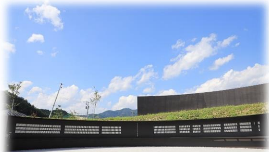
東日本大震災犠牲者慰霊追悼施設 「釜石祈りのパーク」