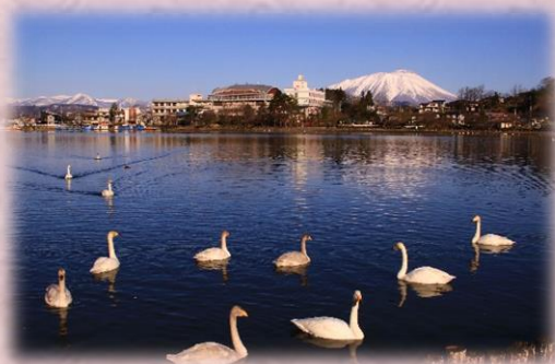
岩手山と高松の池(冬)