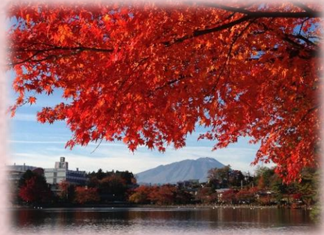
岩手山と高松の池(秋)