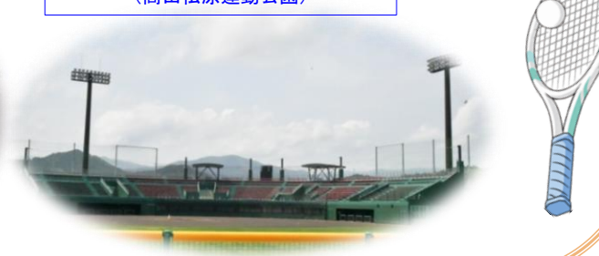
楽天イーグルス奇跡の一本松球場 (高田松原運動公園)