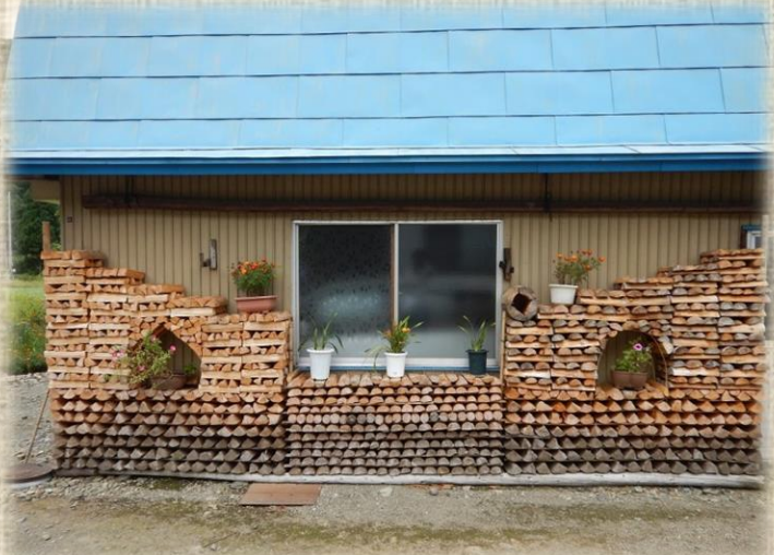
同時開催の「薪積み・薪作りコンテスト」の作品