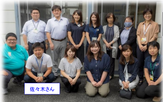
保健福祉課 福祉係の みなさんと